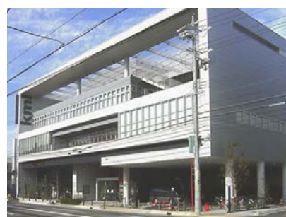
三重県桑名市立中央図書館様

さらに、「公衆無線LANシステム」を新たに整備したため、インターネットコーナーだけでなく、館内で利用者様のスマートフォンやノートパソコンからもインターネットを利用できるようになりました。