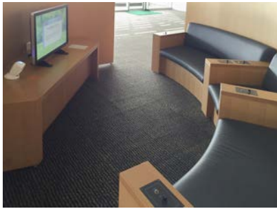
ゆったりと視聴可能なAV端末