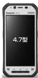
頑丈4.7型ハンドヘルド TOUGHPAD FZ-N1

PBX/ビジネスフォンをクラウド化することにより、通信設備・保守コストの削減ができます。また、スマートフォンを内線端末化でき、オフィス内外での利用が可能となります。レイアウト変更についてもWeb上でラクラク設定ができ、運用費用の削減も可能です。