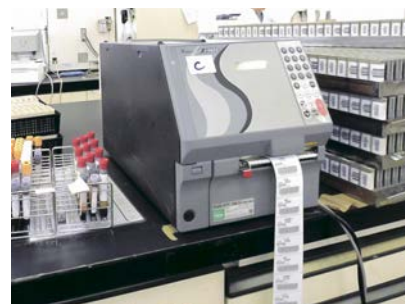
OCR処理からスピーディなラベルプリントまで

*従来、15時から18時半まで、20人がかりで3時間半かかっていた作業が、15時から早ければ16時半の、約1時間30分に大幅短縮