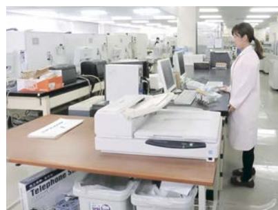
検査依頼書のスキャナー読み取り作業