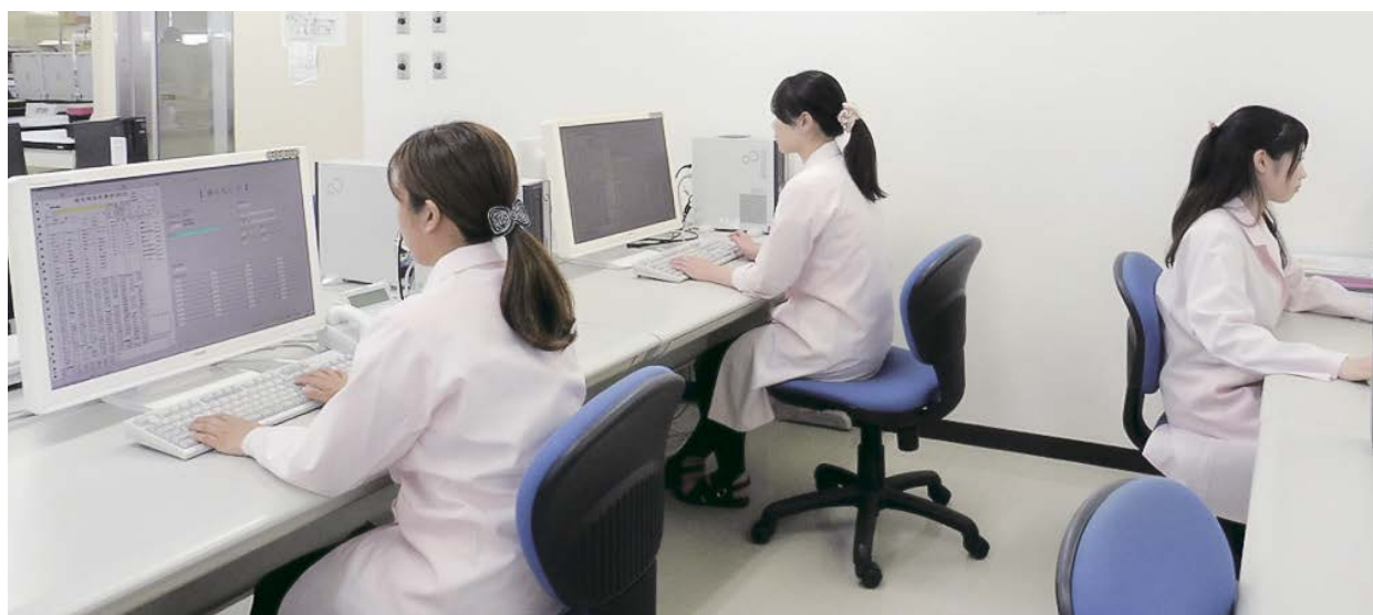
大量の検査依頼書を処理するセンターのデータ化・修正作業