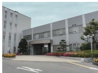
一般社団法人 半田市医師会 健康管理センター

従来、検体の検査依頼書の入力、届けられた大量の依頼書を、20名のスタッフでデータ入力をしており、非常に手間と時間のかかる作業でした。全体の業務を効率化したいという要望から、スキャナーとeFlow（臨床検査受付入力システム）で紙文書から簡単にデータ化するシステムの導入を検討いただきました。