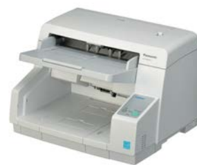
ドキュメントスキャナー KV-S5055CN