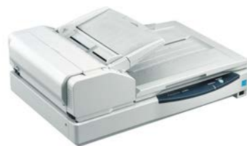
ドキュメントスキャナー KV-S7075CN