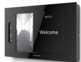
KPASチェッカー 壁掛けタイプ×22台

■発行 パナソニック株式会社 コネクティッドソリューションズ社 〒104-0061 東京都中央区銀座8丁目21番1号 汐留浜離宮ビル 商品サイト https://panasonic.biz/cns/invc/kpas/