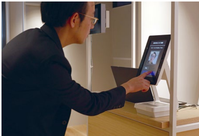
▲ 受付のレジスターで簡単に顔認証登録ができる。名刺スキャンにより氏名と社名に紐づけた登録が可能。