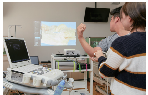
▶肘の内側靭帯を超音波エコーで検査しながら、肘関節を構成する骨格と筋肉を解剖映像で確認しているところ。