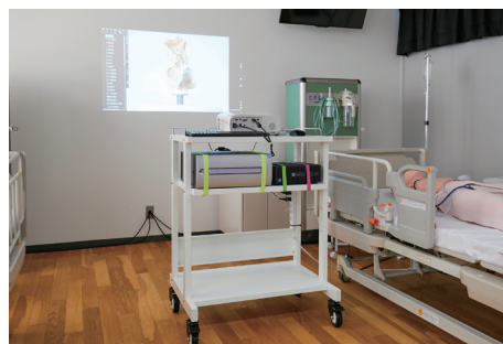
▶多視点3D解剖教育システムとプロジェクターを医療用台車にセットすることで、さまざまな教室へ運べて利便性も高めた。