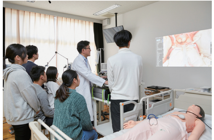
▲呼吸音や心音の聴診、心電図などのバイタルサインをシミュレータで学習し、症状の発生している部位を3D実写映像で確かめながら授業を進める。