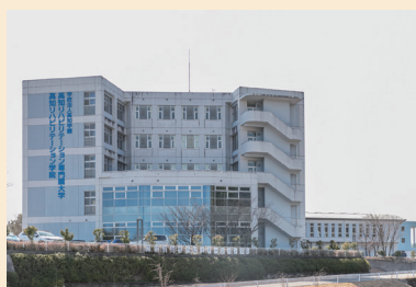
▲2019年に日本初の専門職大学として開学し、専門学校と併設される