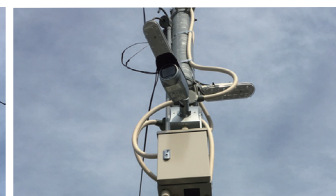
監視カメラへはPoE給電されるので設置するだけで稼働