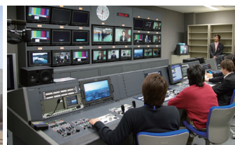
岡山県内最大のケーブルテレビ局