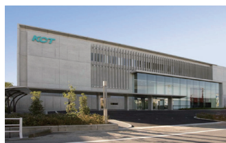
株式会社倉敷ケーブルテレビ様

AES128 ビットによる通信保護機能と録画データ暗号化によりコンテンツを保護。