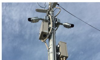
監視カメラと共に設置されている「監視カメラ用 60GHz通信BOX」