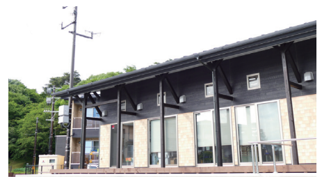
観光センターにも設置