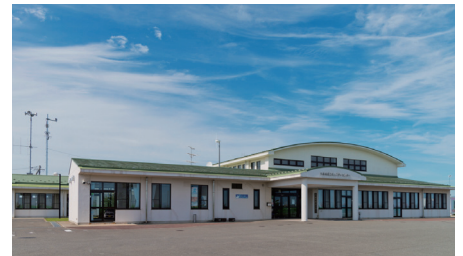
大曲市民センターと設置された無線設備