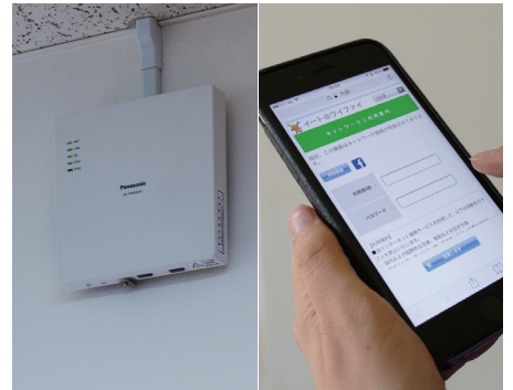
屋内Wi-Fiアクセスポイント(左) 市民センターなど11箇所で使用可能

イト@ワイファイ（無線LANアクセスポイント環境）を活用した見守りシステムで、高齢者や児童などが市民センターなどに立ち寄ったことを確認できるようになります。