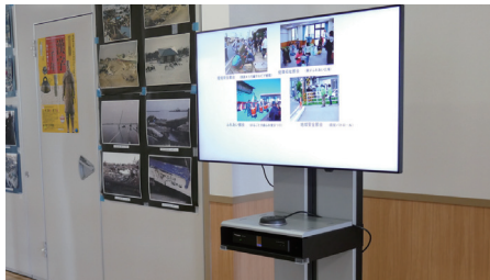
デジタルサイネージソリューション「AcroSign」を使用し市民センターや市役所からのお知らせを情報配信