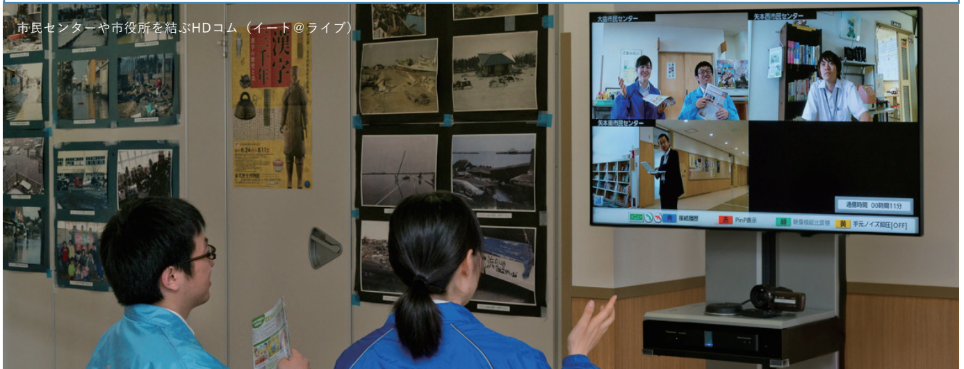
市民センターや市役所を結ぶHDコム（イト@ライブ）

2011年におきた東日本大震災で、津波の被害が大きかった宮城県 東松島市様では、被災以前から地域づくりや生涯学習活動などの拠点であった公民館（市民センター）が中心となり、震災当時から避難所運営、復興方針決定、高台移転の地域意見集約で大きな役割を果たしてきました。