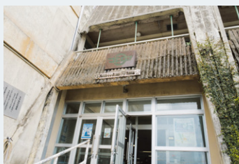
▲北中城村様の役場の第一庁舎

防犯カメラの設置にあたり、住民のプライバシー保護は必須でした。そこで、撮影したカメラ画像に対して、住宅などが映り込む際はその部分を覆い隠す(マスキング)仕様や、監視センターのモニターなどで常時監視されるのでは、という住民の不安へ配慮から、警察から画像の提供依頼があった際に対象のカメラに対して日時を指定した上で都度画像を取得する方式を求めました。また、海沿いへの設置は耐重塩害仕様のシステムが必要でした。様々な条件のもとで公募型プロポーザルを行った結果、最も評価の高かったパナソニックの防犯カメラシステムを選定しました。