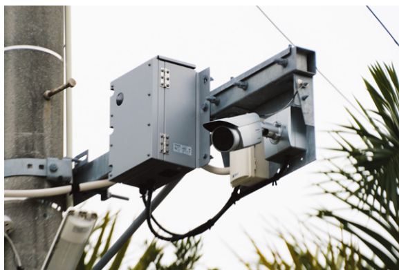
▲住宅が映り込む場合はマスキング処理を実施