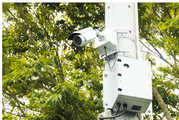
▲電柱の上部など高所に取り付けられた防犯カメラシステムとネットワークカメラ用60 GHz通信BOX