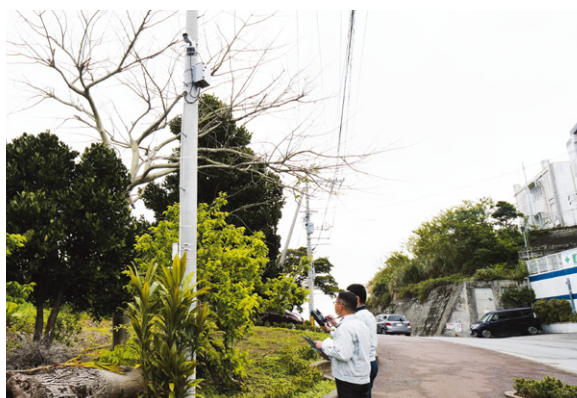
▲村民の安全を考えて、小学校・中学校の通学路などを中心に設置