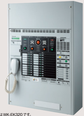
写真はWK-EK320です。 WK-EK300 / WK-EK300NTシリーズ