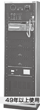
49年以上使用 WL-5090 / 5590シリーズ 1973年生産完了