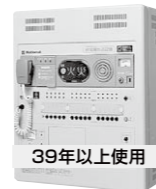
39年以上使用 WK-600シリーズ 1983年生産完了

これらの商品は、ご使用から35年以上経過しています。平成6年の消防法改正にも未対応です。