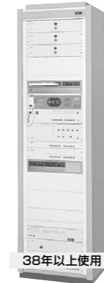
38年以上使用 WL-6000 / 6500シリーズ 1984年生産完了