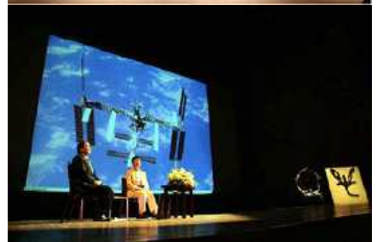
シンポジウム風景