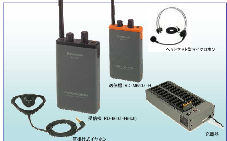
ヘッドセット型マイクロホン