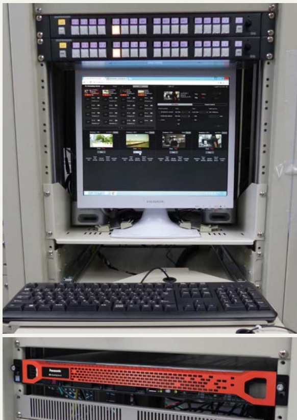
放送局内に設置されたP2 CastおよびP2 Streaming Serverの端末