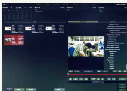
P2 Castの操作画面。 AVC-Proxy G6の6Mで撮影。 本線はAVC-LongG25の25M