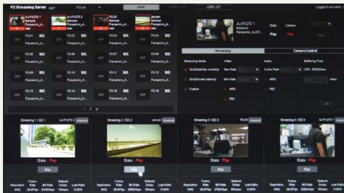
P2 Streaming Serverの操作画面。1画面で最大20カメラ分のサムネイルを表示可能