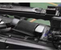
LTE通信用のUSB dongleが 取り付けられたAJ-PX5000