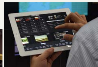
P2SSの端末と別の場所にある タブレットやノートパソコンでも取材 映像をコントロール可能

株式会社TBSテレビ様は、常に新しい放送技術を検討・検証することで、一層正確かつスピーディな報道体制を構築することを追求されています。その一環として、新しいニュース制作ワークフローをご検討される中、クラウドを活用したパナソニックのストリーミング映像伝送システム「P2 Cast」および「P2 Streaming Server」を採用されました。複数のメモリーカード・カメラレコーダー AJ-PX5000やAJ-PX270で撮られた映像は、同時にLTE回線経由で放送局へ伝送され、リアルタイムでストリーミングを行うことができます。放送局内では1画面に最大20台のカメラ映像をサムネイル表示(カメラの入力は最大1000台まで可能)できる同システムが、ニュース制作環境の大きな革新につながることを期待されています。