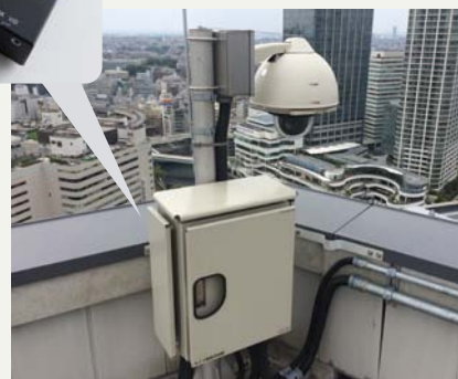
屋上に設置された4Kインテグレートドカメラ AW-UE70K

富士ゼロックス株式会社様は、2010年(平成22年)、既存の研究開発拠点を集約した富士ゼロックスR&Dスクエア(神奈川県横浜市)を建設されました。その3階フロアには、新しい価値をお客様と一緒に創っていく場「お客様共創ラボラトリー」が設置されています。2015年(平成27年)、4K HDMI・IP光伝送器の開発にともない、同フロアへこの機器を展示することになり、その入力ソースとして4KインテグレートドカメラAW-UE70Kが採用されました。屋上に設置されたAW-UE70Kで撮影した映像は、4K HDMI・IP光伝送器を使うことで約160m離れた3階フロアの98型4Kモニターへリアルタイムで表示。リモートカメラコントローラー AW-RP50を使用して円滑で遅延のないパン/チルト/ズーム制御も行えるなど、富士ゼロックス株式会社様の新しいソリューションを発信するデモンストレーション展示として、来社するお客様への訴求へ大きな効果を発揮しています。