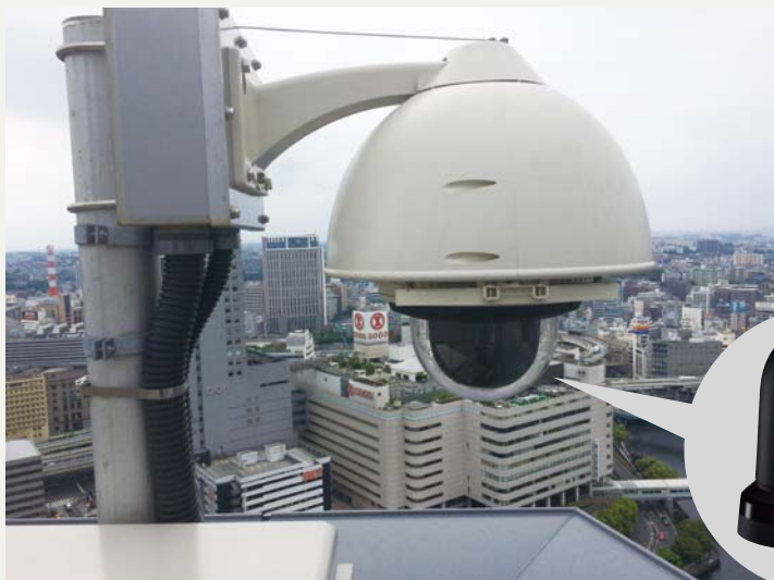
4KインテグレートドカメラAW-UE70Kは屋外ハウジングへ格納