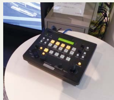
98型4Kモニター(左下写真)の横に設置された リモートカメラコントローラー AW-RP50