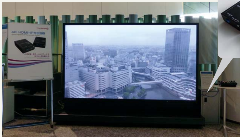
「お客様共創ラボラトリー」の98型4Kモニターで 横浜の風景をライブモニタリング