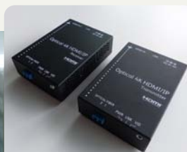
屋上に設置された 富士ゼロックス株式会社様の 4K HDMI・IP光送信機(写真右)と モニターへ接続された4K HDMI・IP 光受信機(写真左)