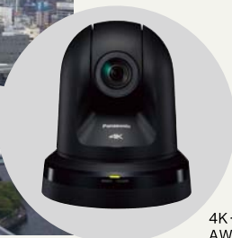
4Kインテグレートドカメラ AW-UE70K