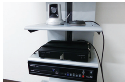
専用ラックに設置されたHDコム