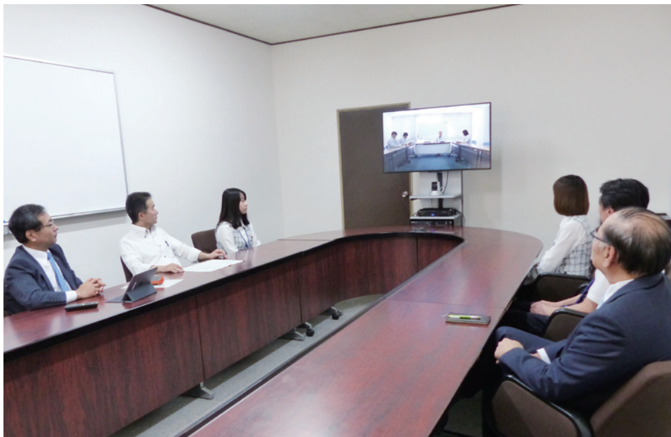
大阪の本社と支店の会議室をつないだビデオ会議の様子