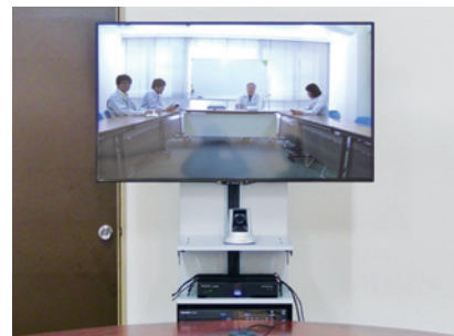
鮮明な画像とクリアな音質で臨場感のあるビデオ会議を実現