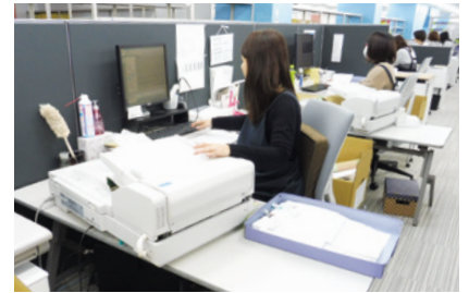
各自の作業スペースに使いやすいスキャナーを配置