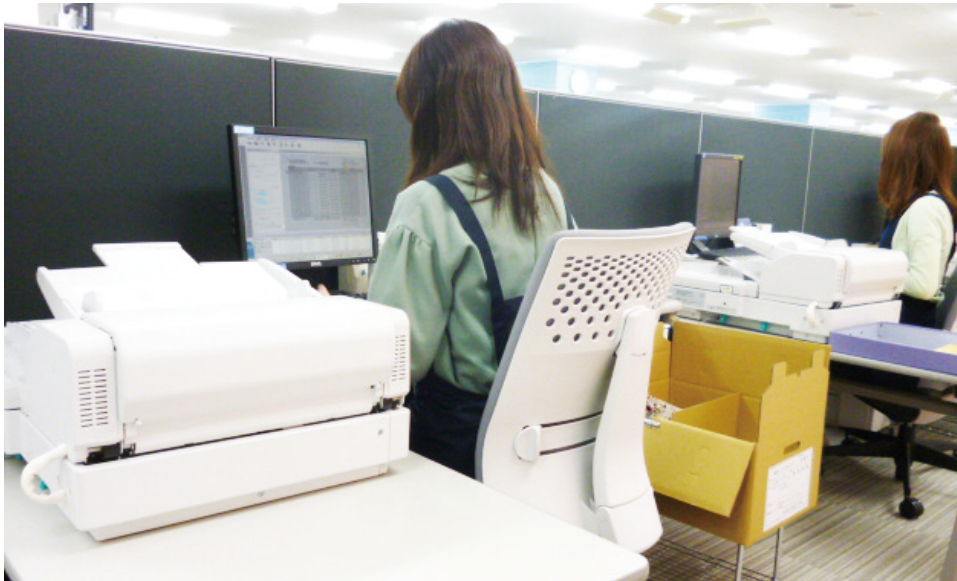
オフィス内に整然と並び、電子化作業のデスク