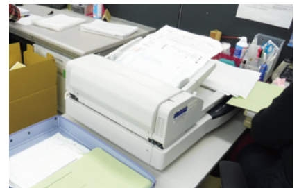
A3サイズの読み取りができるKV-S7075CNをフル活用