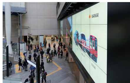
真横に近い位置からでも輝度・色が変わることなく見えるIPS液晶パネルを採用

また、合わせてデジタルサイネージシステム「AFFICHER®(アフィシエ)」を導入することで、配信管理などのオペレーションを、クラウドを介してモバイルパソコンなどからの遠隔操作も可能になっています。「『NGTV』は公共の場にあるわけですから、常に万が一の状況に備えておく必要がありますので、どこからでも速やかに対応できるアクセス環境の構築は欠かせません。機器のみならずシステムまで“パッケージ”でご提案いただき導入できたことは、業務に臨むうえでとても安心感がありますね」(井置様)。