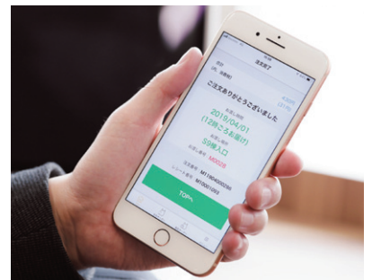
来店せずにモバイルオーダーを行うスマートフォン