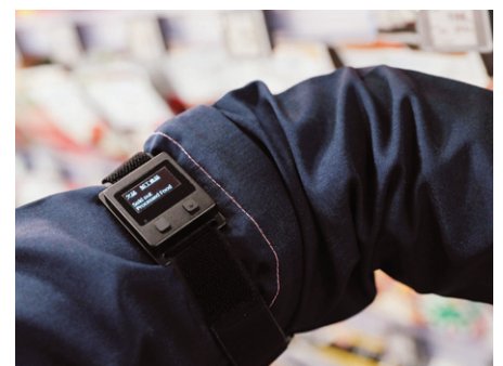
従業員の腕に装着された業務アシストシステム