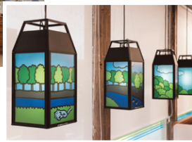
先進技術を活用したイートインスペースの空間演出