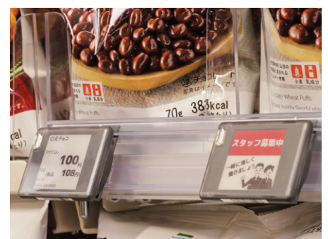
一括で管理され、柔軟に内容を変えられる電子棚札