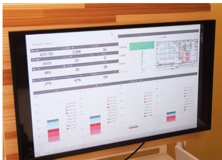
IoT データマーケティングのための状況表示ディスプレイ