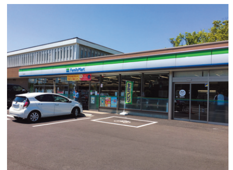
パナソニックの佐江戸事業場（横浜市）に隣接したファミリーマート佐江戸店

従来は手作業で行っていた商品の価格表示や店内POPの作成・入れ替え業務を、約2000個の電子棚札を活用して電子化。確認・実施に時間のかかる作業を効率的に行えるようになっています。店舗オペレーションの大幅な効率化に貢献します。