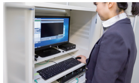
捜査機関からの申請により防犯カメラの映像をダウンロード