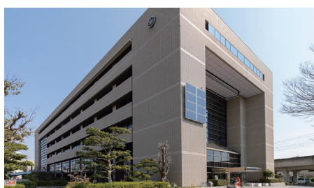
兵庫県 川西市役所

防犯カメラの設置場所選定に際しては、川西警察署のアドバイスを元に、過去に子供たちが巻き込まれた事件や事故が発生した場所や、学校周辺の交差点、人通りの少ない場所などを中心に基本となる設置場所案を作成。その案を元にコミュニティ組織を通じて地域の方の意見を聴きながら、地域のご要望を最大限に反映させた設置場所になるように決定していきました。