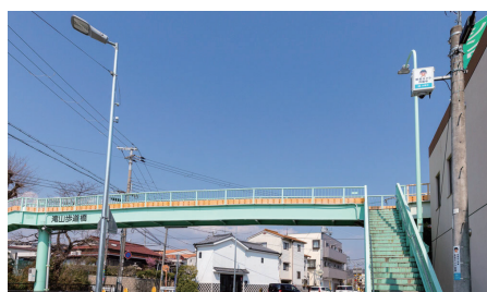
通学路の交差点付近に設置された防犯カメラ