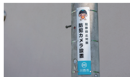
防犯カメラを設置した電柱には告示板を併設