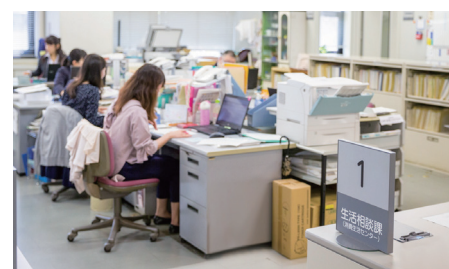
市民環境部 生活相談課