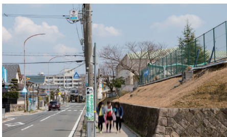
通学路の交差点付近に設置