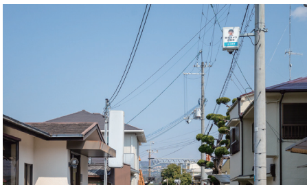
通学路の各所に設置

川西市様では、事件や事故の発生時に、防犯カメラ映像を捜査機関へ適切に提供し、犯人や事故原因の早期特定、事件解決に貢献していくことで、犯罪や事故が発生しにくい地域づくりを目指されています。