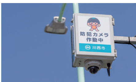
防犯カメラにはi-PRO SmartHD屋外対応型ドームネットワークカメラ WV-SFV611Lを採用