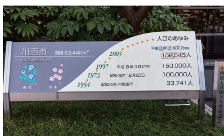
約16万の人口を有する川西市