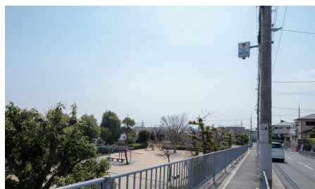
子供たちが遊ぶ公園横にも設置