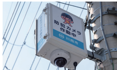
イメージキャラクターの「きんたくん」が通学路を見守っている