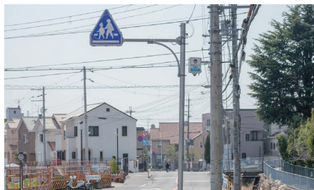
学校から離れた通学路にも設置