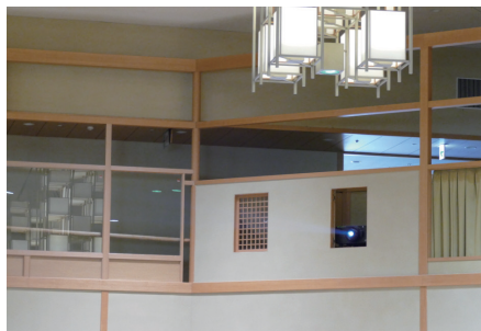
大広間に設置されたプロジェクター

お問い合わせは 〒104-0061 東京都中央区銀座6丁目21番1号 汐留浜離宮ビル