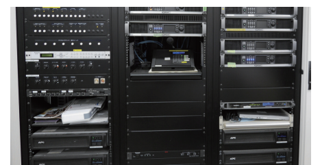
音響サーバーラック (左上) 分散設置のアンプラック (下) 4Dスピンコースター「嵐」機器ラック (右上)