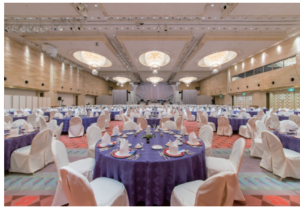
ホテル花水木コンベンションホール