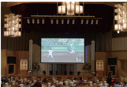
温泉施設 湯あみの島の大広間には 220インチの大画面を設置