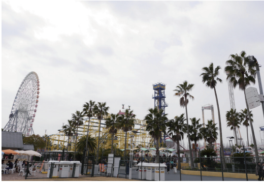
RAMSA屋外用ラインアレイスピーカーが設置された芝生広場会場