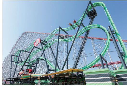
3月にオープンした4Dスピニングコースター「嵐」