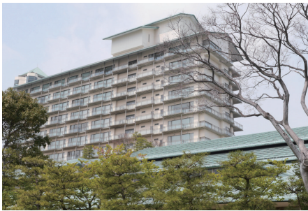
ジュニアサミットも行なわれたホテル花水木

温泉「湯あみの島」にある開放的な大広間には220インチの大型画面に映し出すプロジェクター(PT-DS20K2J)が設置されています。