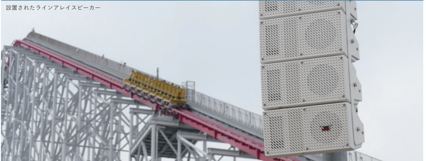
設置されたラインアレイスピーカー

国内最大級の大型アミューズメントパーク ナガシマスパーランド様は、開業 52 周年を迎え、音響設備の改修を計画し、遊園地内と宿泊施設内のコンベンションホールの音響設備を導入されました。