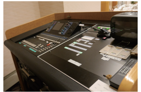
ホテル花水木宴会場操作卓