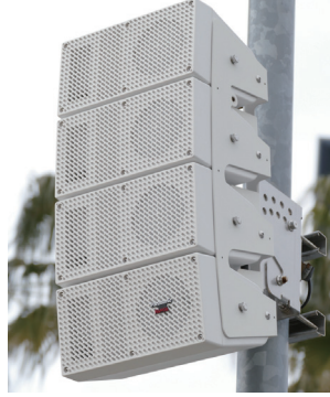
ラインアレイスピーカー