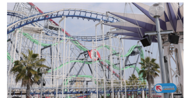
ナガシマスパーランド