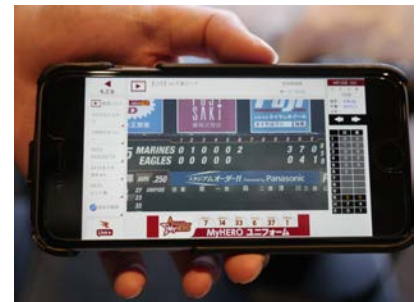
リプレイを短編動画としてSNS配信