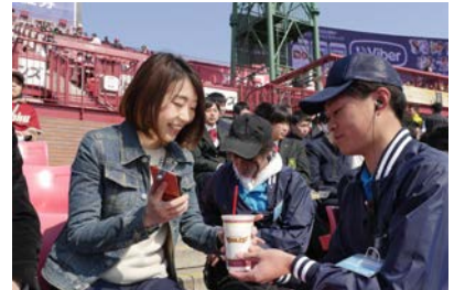
座席を立たずに注文商品をデリバリーしてもらえらる（デリバリー費用は有料）

楽天野球団様では左中間後方の楽天山観覧席とその周辺（合計約 4,000 席）部分を拡大し、約 4,000m 2 に広がった敷地に約 7,000 人を収容する「スマイルグリコパーク」を建設。この公園の象徴として、日本の野球場で初となる観覧車を設置し、5月3日より運用を開始しました。この観覧車の駆動中心部には、直径 3m の円形ビジョンが設置され、楽天イーグルスの勝利時や選手がホームランを放った時など、他ビジョンとの連動のほか、観覧車の待ち時間なども表示されます。