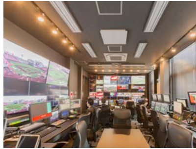
コントロールルーム内全景