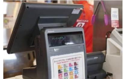
店舗のPOSシステムも新たに導入