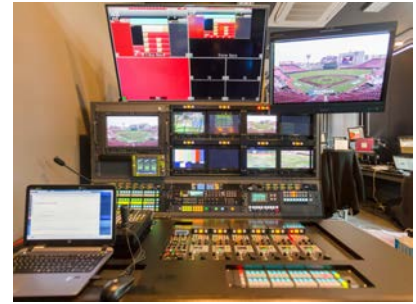
コントロールルーム