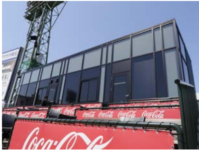
コントロールルーム外観