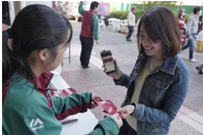
選手の写真や当日撮影した写真をスマホから注文・受取り