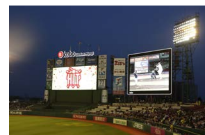
ナイター時のビジョンの様子