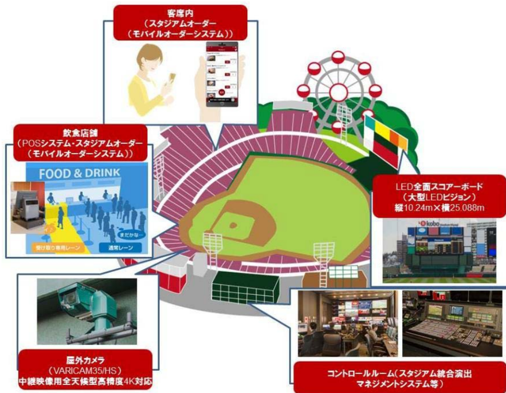
スタジアムソリューション全体イメージ