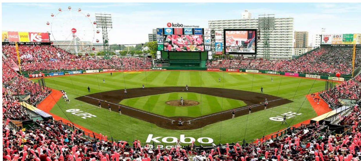
楽天koboスタジアム宮城全景

大型LEDビジョンやスタジアム統合演出マネジメントシステムを中心とする最新のスタジアムソリューションを導入