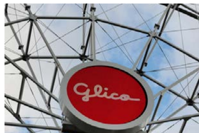
直径3メートルの円形ビジョン