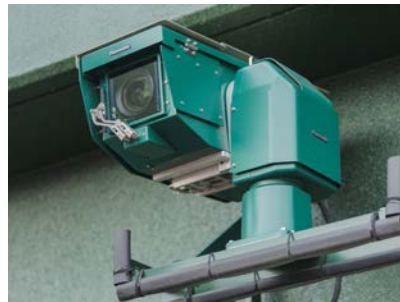
屋外カメラ (VARICAM35 HS) 中継映像用全天候型高精度 4K 対応