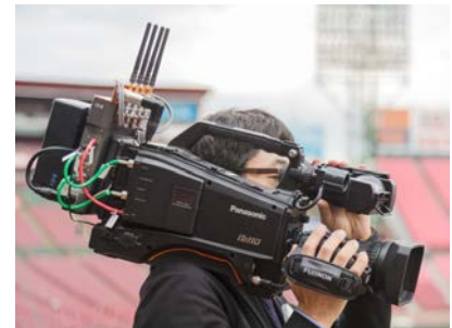
ワイヤレスカメラ (P2 ハンディカメラレコーダー AJ-HPX380 型) 演出用に球場内のいたるところを撮影し映像を伝送する