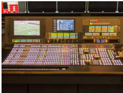
大型ライブスイッチャー AV-HS7300