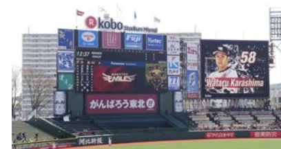
大型LEDビジョン (左) と他社製のビジョンが並ぶ