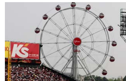
他ビジョンとの連携も可能