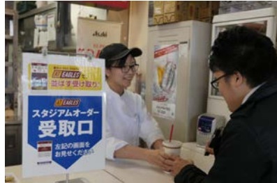
レジ横にある受取口で画面を見れば並ばずに注文した商品を受け取ることができる