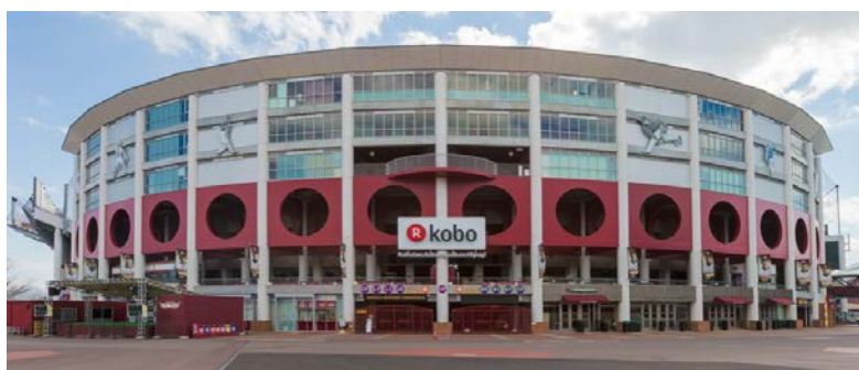
楽天Koboスタジアム宮城

株式会社楽天野球団様は、本拠地である「楽天 Kobo スタジアム宮城」（仙台市宮城野区）を「東北のランドマークとして世界に誇れるボールパーク」を目指し、毎年、球場の改修を行っています。主にグラウンド天然芝化やスコアボードの全面 LED 化、さらに左翼外野席後方を公園として整備し、3万人を超える収容人数に拡大を図るなど、球場の魅力を高めることを目的とされています。この「ボールパーク構想」に基づき、今回様々な映像系・ICT システム及びソリューションによるスタジアムソリューションを導入されました。