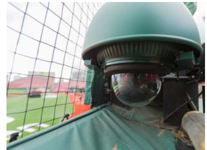
戦略分析システムに用いられる全天候型4Kドームカメラ (AW-UE70型)

また、4K インテグレートドカメラ AW-UE70 と 12ch のリアルタイムエンコーダにより、試合終了と同時にコーチ・選手の戦略分析を可能にする「戦略分析システム」や球場内光 IP ネットワークインフラなどを構築されました。