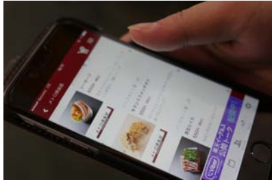
アプリをダウンロードして事前注文・決済が可能。準備ができたならメールで連絡が届く

さらに飲食店舗で待たずに商品を受け取る事が出来る「スタジアムオーダー」（モバイルオーダーシステム）を日本で初めて導入されました。これは、お客様のスマホに楽天イーグルス公式スマホアプリ「At Eagles」より無料でダウンロードした「スタジアムオーダー」アプリから事前注文・決済を行い、球場内の店舗で、受取り番号を提示すると支払済みの商品と引き換えることが可能なシステムです。レジ待ちの時間を短縮することができ、さらに、アプリで座席番号を登録すると商品をお客様の席までお届けする「デリバリーサービス」も実施しています。