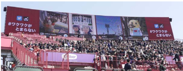
「SNS ファンメッセージビデオ表示システム」は SNS でのファン投稿を大型 LED ビジョンに表示