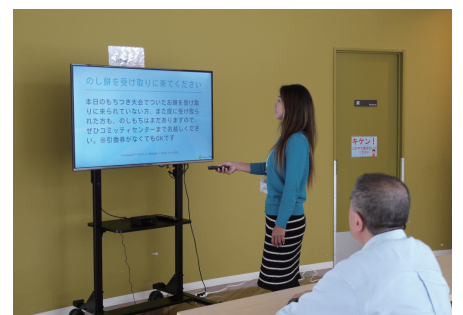
住民が多く集まるコミティセンター（集会所）にも情報受信端末が設置されています