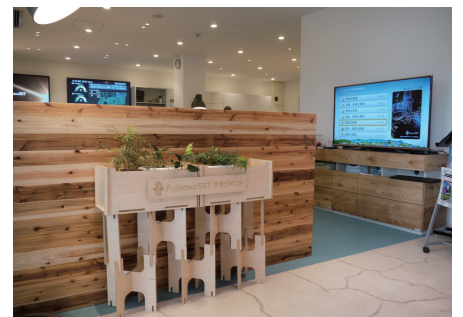
オフィス（タウンマネジメントオフィス）にも情報受信端末を設置し、専用スタッフ6名で運用しています

※2 詳しくは、商材紹介サイト ( http://sol.panasonic.biz/digitalsignage/system/pa001.html ) をご確認ください。