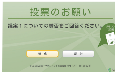
双方向コミュニケーション機能を活用したメッセージ配信例