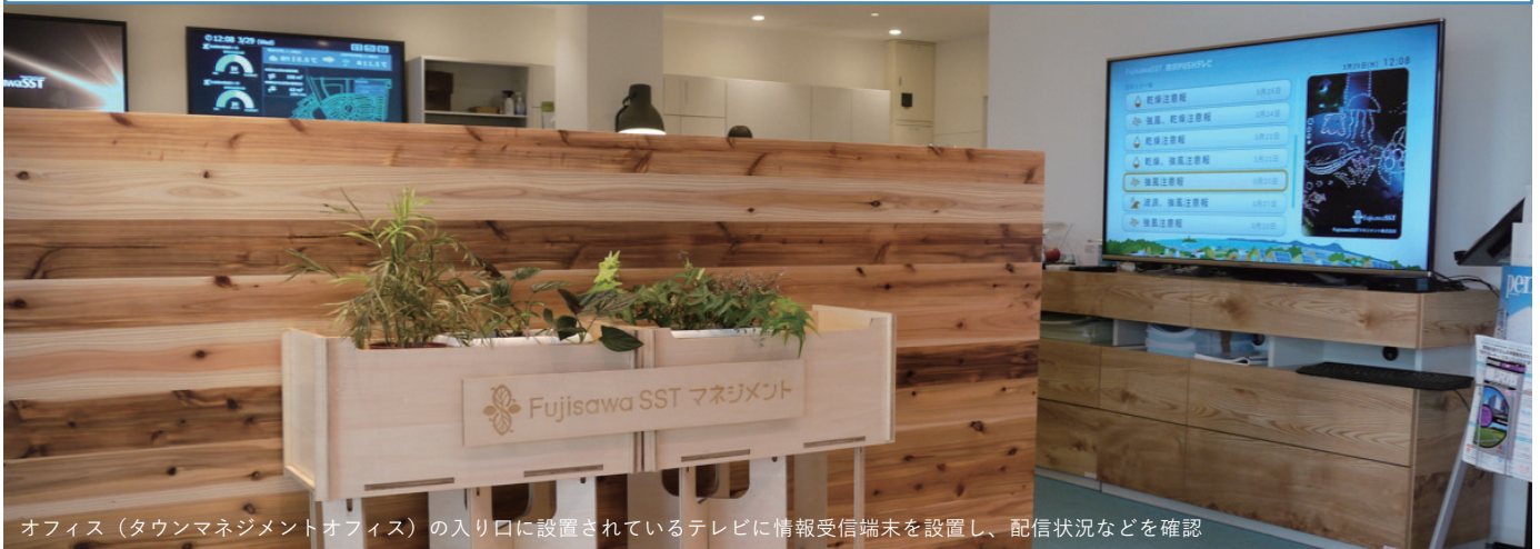
オフィス（タウンマネジメントオフィス）の入り口に設置されているテレビに情報受信端末を設置し、配信状況などを確認

タウン情報配信や、双方向コミュニケーション手段として活用。 緊急時には、Lアラート情報を一斉配信