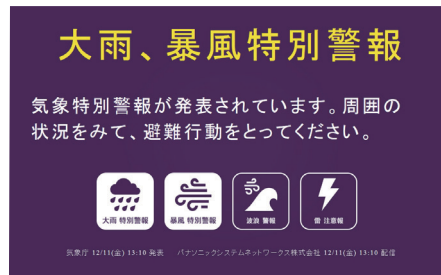
Lアラート情報のメッセージ配信例