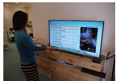
リモコンを使用して配信された情報の確認が可能です