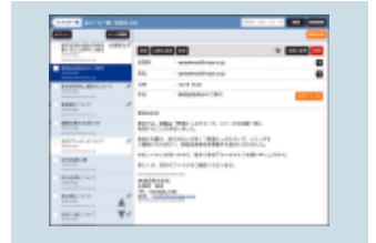
▲タブレットの画面例