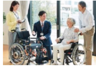
▲フロンティア様の業務イメージ