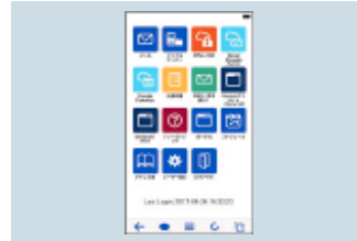
▲スマートフォンのTOPイメージ