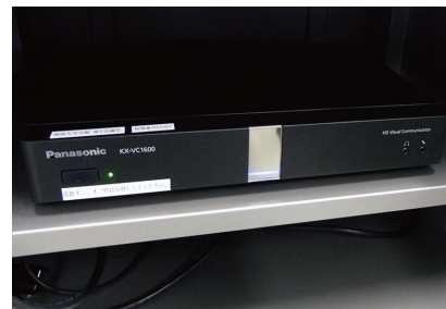
専用ボックスに設置されているKX-VC1600J