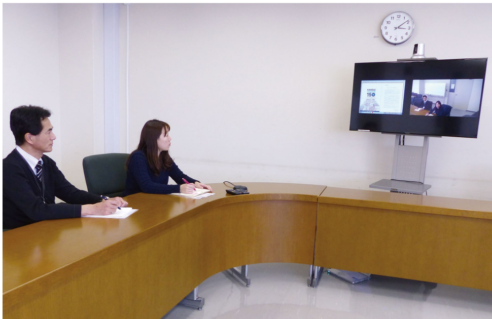
離れたキャンパスの会議室をつないで事務会議を実施