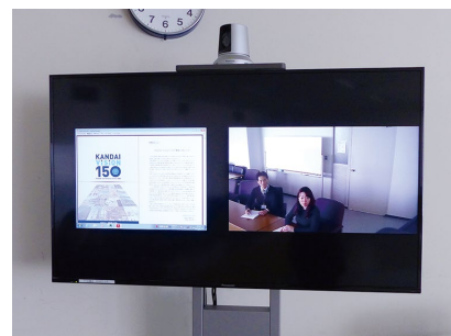
ディスプレイ上に専用カメラを設置し、状況にあわせた映像を撮影