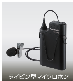
タイピン型マイクロホン