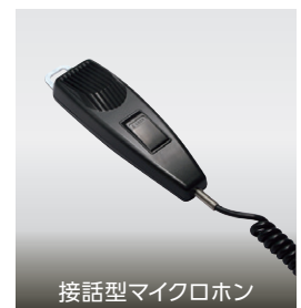
接話型マイクロホン