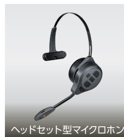
ヘッドセット型マイクロホン