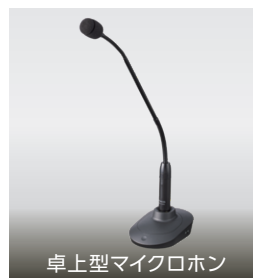
卓上型マイクロホン