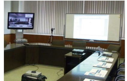
配布資料をプロジェクターで共有しながら進行