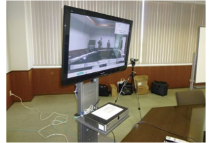
ディスプレイとHDコムは専用スタンドに設置