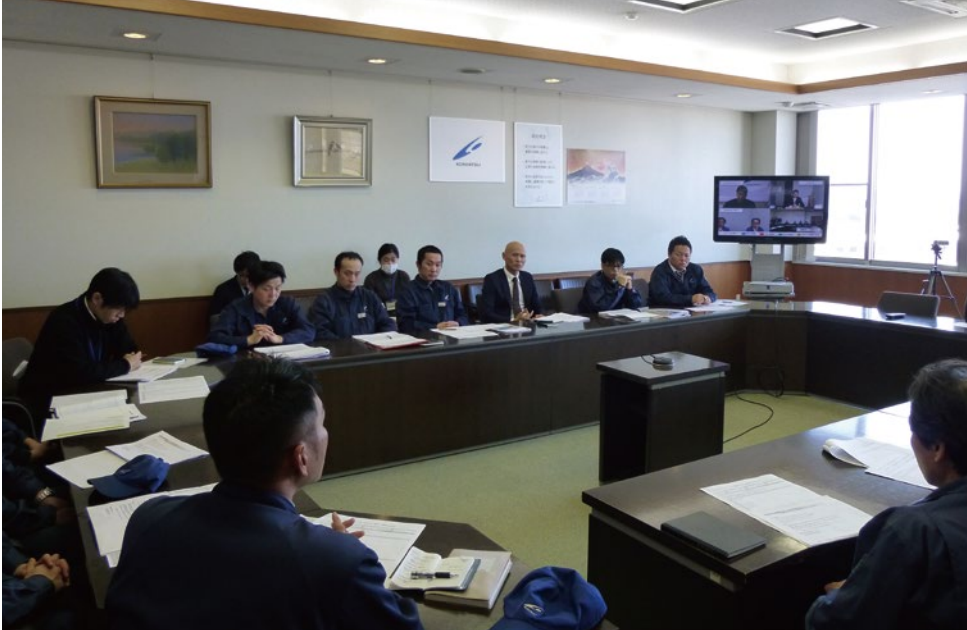
高松本社の大会議室と各拠点と接続した会議の様子