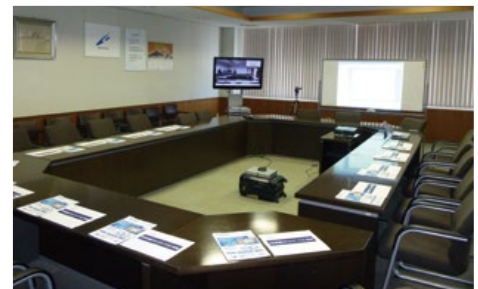
高松本社の大会議室

生産拠点にいる工場の技術者やオペレーターは、社外に出張する機会がありません。そのため、別工場の担当者とは電話でのやりとりのみで声しか聞いたことがない状況が長い間続いていました。しかし、HDコムの導入後は全国の担当者の顔を見ながら会話ができるため、今まで以上に親近感が湧き、リラックスして会話に集中できるようになりました。そのため会話も活発になり、本質に迫った話ができるようになりました。また、HDコムを導入している関連社外との打合せが発生した場合でも相手先に向くことなく行えるため、社外との連携が速やかに行うことができます。これらの効果により、小松印刷株式会社様の強みである生産品質・効率がさらにアップし、一層お客様のニーズへ柔軟に対応するためのシステムが構築できました。