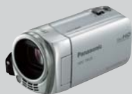
●HDビデオカメラ HDC-TM25 (×2)