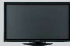
●37インチ プラズマディスプレイ (×2)