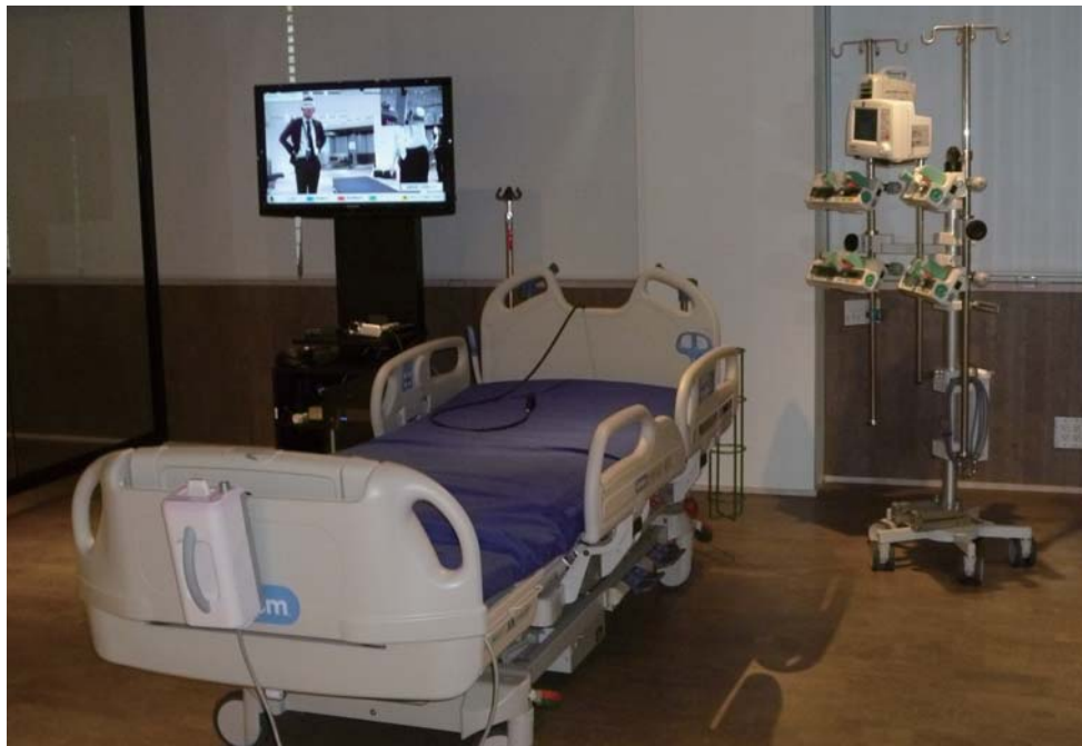
ICUなどの各種機器をそろえて臨床現場を再現した「メディカルデザインスタジオ」