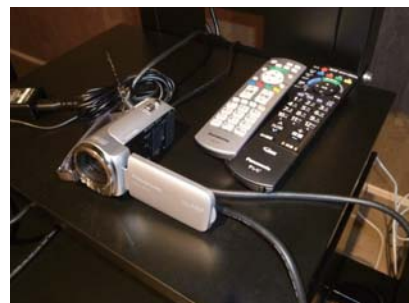
スタジオ内の様々な場所へ持ち歩きが便利なカメラ