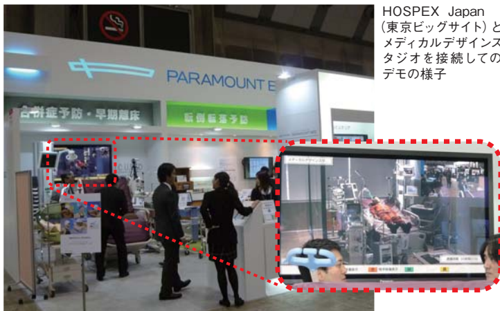
HOSPEX Japan (東京ビッグサイト) とメディカルデザインスタジオを接続してのデモの様子

商談の現場である病院とショールームをHDコムで接続することにより、メディカルデザインスタジオに設置してある機器のデモを離れた場所に対しても行うことができるようになりました。病院にいる営業マンが現場でショールーム機器の説明を行うことで、病院を離れることができない専門医にも説明が可能になりました。まさに、「現場にとびだすショールーム」の実現で、業務効率化を実現しています。他にも医療機器業界展「HOSPEX」で会場ブースとHDコムで接続しましたが、音声遅延もなく、画質も鮮明。今後開催される「集中治療学会」についても同様の活用を予定いただいております。