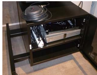
鍵がかかるスタンドのボックスに収納された KX-VC600