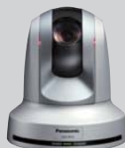
●HD インテグレートドカメラ AW-HE50 (×5)