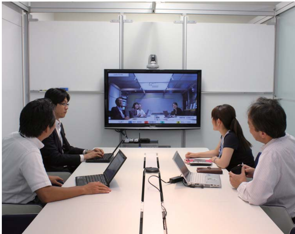
まるでディスプレイの奥までテーブルがつながっているような感覚で、ディスプレイ内の相手を身近に感じながらのミーティング