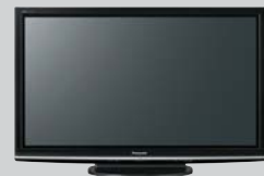
●プラズマディスプレイ TH-P50G1EH (×5)