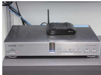
PC画面をワイヤレスでディスプレイに表示できる「ワイビア」と接続されたHDコム