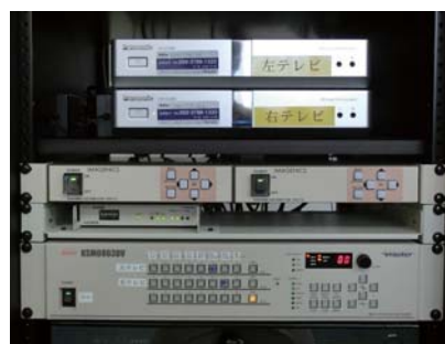
システムをラックに収容して操作性を向上