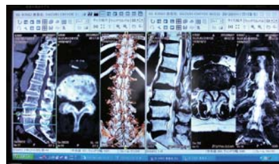
CT、MRI、レントゲンの画像を一度に2つのモニターへ表示して使用