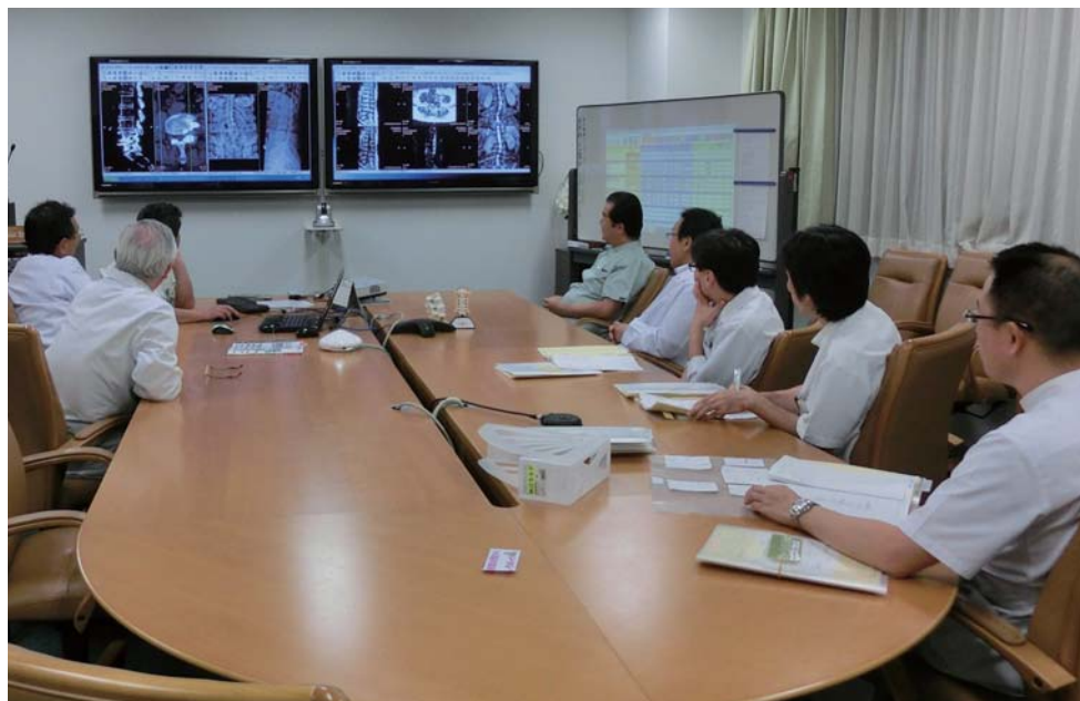
診療後、毎日行われている東京・銀座の分院との定期カンファレンスの様子