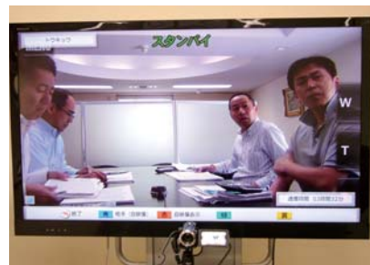
表情まで鮮明に映し出された東京本社側の映像