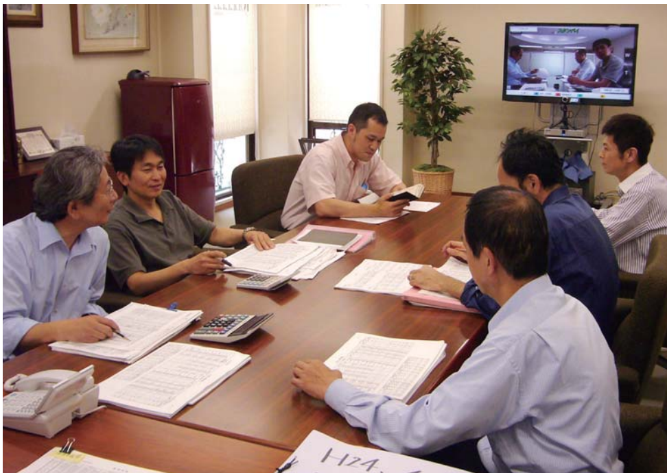
大阪本部と東京本社をつないでの役員営業会議の様子