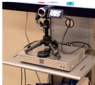
KX-VC300の上に三脚でカメラを固定