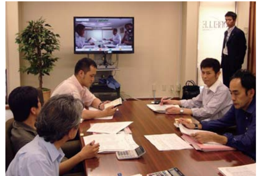
会議以外に、デザイナーとパタンナーの打ち合わせにも活用

従来使用していた他社製品に比べ、音質が格段に良くなったことでストレスがなくなり、以前よりも会議の進行がスムーズになりました。これにより週1回は必ず HDコムで会議を行うようになったと好評です。また、以前は役員営業会議のみの使用でしたが、画質が良くなった事で、それ以外での用途にも活用されるようになりました。例えば東京のデザイナーと大阪のパタンナーの打ち合わせでは、HDコムで実際の映像を見ながらマネキンにサンプルを着せて見せることで、その場で仕様を決定できるようになり、プロジェクト期間の短縮とコスト削減に貢献しています。今後は、大阪と九州間で実務の打合せをテレビ会議で行いたいとのご要望があり、増設を検討いただいております。