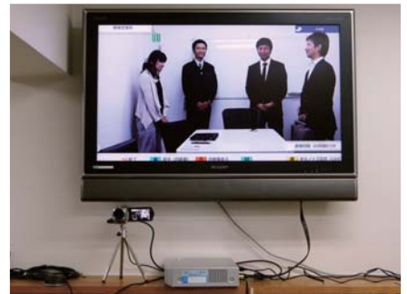
毎朝の朝会にも活用し、スピーディな情報共有が可能に

HDコム導入後は、会話が途切れたりタイムラグが生じることなく、円滑なコミュニケーションが取れるようになり大変満足いただいております。話し手と聞き手の双方向のコミュニケーションが可能になったことで、勉強会では積極的なディスカッションが可能になりました。PC画面の共有も全地点で1人が操作するだけなので会議に集中でき、話し手が相手の様子を確認しながら話せるので、会議の質も高まりました。また、本来想定していなかった朝会での活用にも発展。全社員が情報を同時に共有することで、情報がスピーディにもれなく伝達できるようになりました。さらに、取引先の方を最寄りの営業所に招いて本社と営業所の三者で打ち合わせができるようになり、効率的な営業に貢献しています。