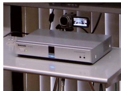
カメラは三脚を使い、HDコムの後ろに設置