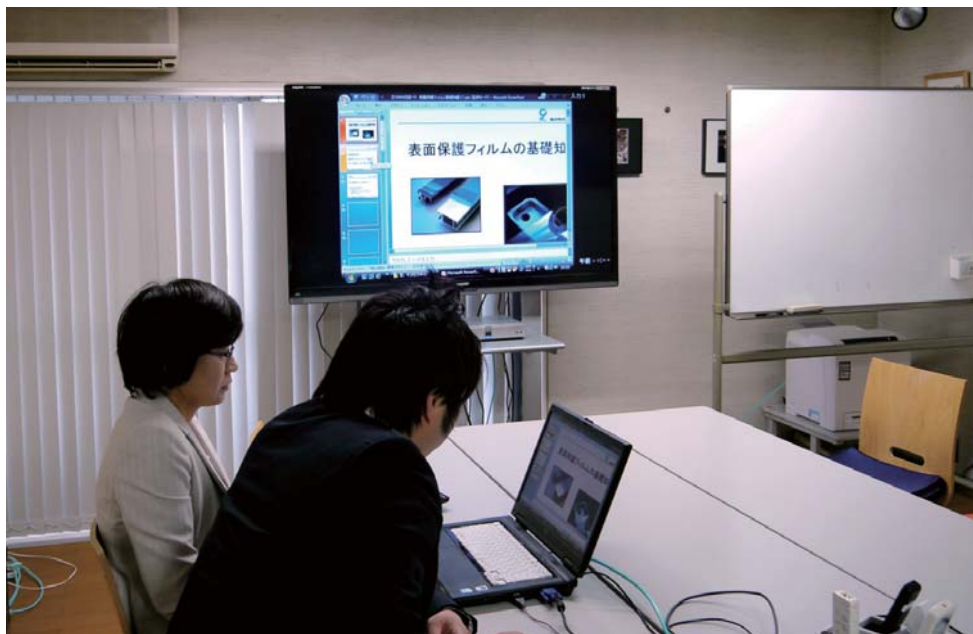
本社（愛知県）と関東営業所（千葉県）を接続し、PCの資料を共有しながら勉強会を実施