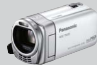
●デジタルビデオカメラ HDC-TM35 (×5)