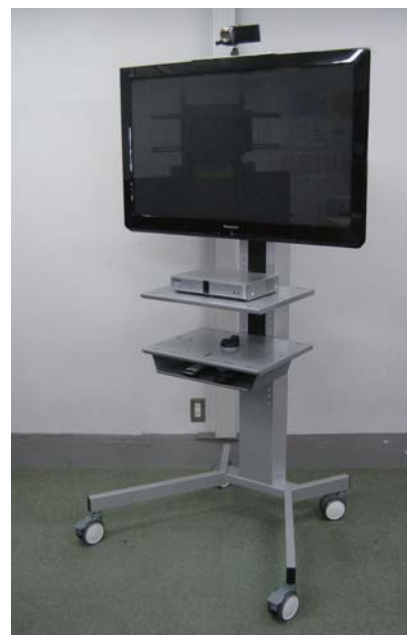
株式会社一ノ坪製作所様製のテレビ会議専用 スタンドKani（カニ）に設置されたKX-VC300