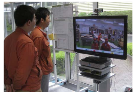
朝会や昼会で、拠点同士の伝達事項や製造に関する情報共有に活用

複数人で同じ質の情報を共有できるようになったことで、伝達のスピードが格段に速くなりました。工場間の生産工程の確認は、エクセルの工程管理表を画面で見ながら共有。新規採用者への作業内容の指示は、ビデオで撮影したものをHDコムで送信することで、離れた場所でも映像と音声を駆使して伝達できるので理解度が高まりました。また、以前であれば不良品が出た場合は現物を送って確認していましたが、現在はメインカメラで写してHDコムで共有。実物を見ながらその場で説明できるので相手の理解も早く、スピーディーに品質向上が図れるようになりました。また、生産に遅れが生じた場合も、別の工場に生産の一部を振り分ける柔軟な対応がHDコムを通して即座にでき、納期に影響を出さない対策が打てるようになりました。