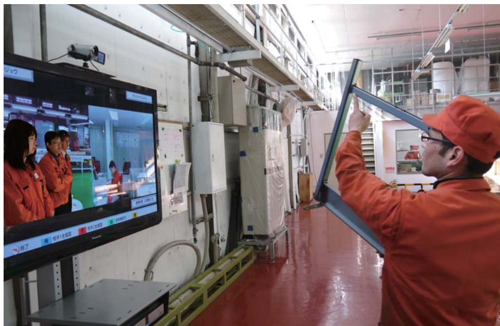
工場間で製品の品質向上のための情報共有や、製品の作り方を説明するのに活用。 奈良県の本社工場と三重工場（画面内の左）、本社事務所（画面内の右）の接続画面