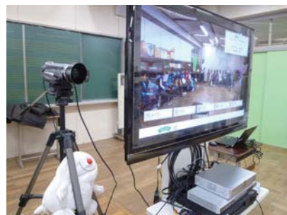
ムービーカメラの下には、児童たちの目線が合うようぬいぐるみが置かれている