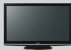
●50インチプラズマディスプレイ (×2)〈既設〉