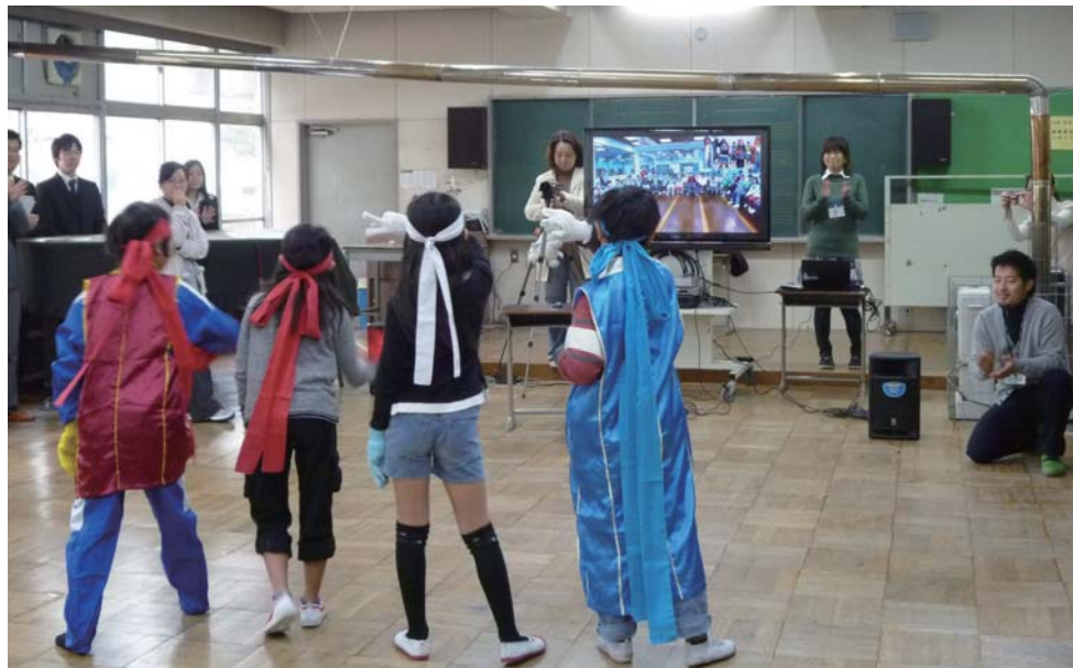
運動会をテーマに台湾の児童に向けて応援団の紹介をする、町田市立南大谷小学校様の児童たち