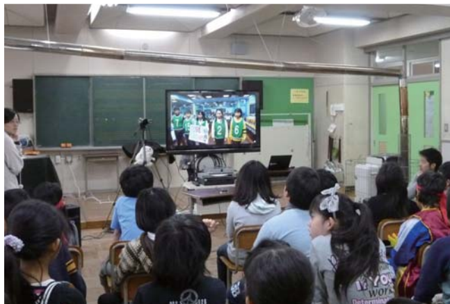
お互いに顔を見ながらの台北市立教育大学附属実験国民小学校様との交流授業

玉川大学リベラルアーツ学部様のアドバイスのもと、HDコムで町田市-台北市の小学校を接続した国際交流授業を始めました。教室の児童全員が一度に参加できるようになったことで、活発な授業ができるようになりました。また、お互いに相手の顔を見て話すことで、反応がリアルタイムにわかるようになり、テンポの良いやり取りにつながっています。HDコム導入により交流授業の「質」が劇的に向上し、子供たちにとっても興味のある楽しい授業となりました。今回は南大谷小学校様をモデル校としてプロジェクトをスタートされましたが、将来的には市内の全小学校に拡張の計画もあり、学校間でフレキシブルに設備を移動して授業ができるよう、ワイヤレス化も検討されています。