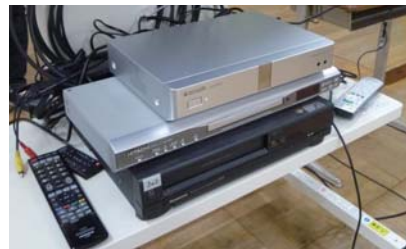
稼働式システムスタンドに設置されたKX-VC300