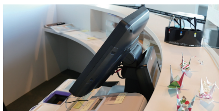
12Fおりづる広場にある「おりづるカウンター」のPOSシステム