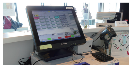
「おりづるカウンター」のPOSシステム