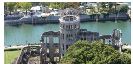
「ひろしまの丘」から見下ろす原爆ドーム