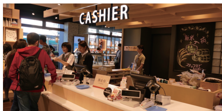
1Fの物産館のカウンターに設置されたPOSシステム