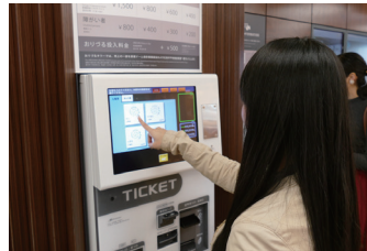
発券システムでチケットを購入