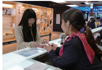
チケットカウンターでの接客がスムーズに