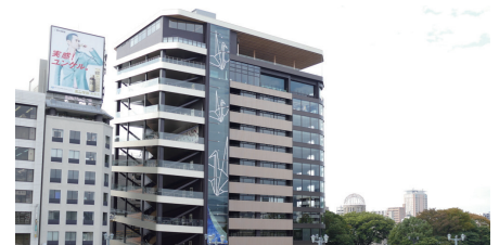
おりづるタワー外観