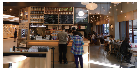
1Fのカフェにも設置されたPOSシステム