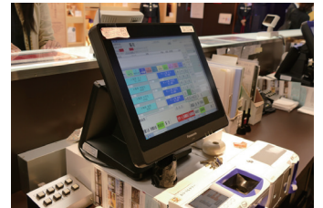
チケットカウンターに設置されたPOSシステム

おりづるタワーに来場したお客様が屋上展望台へ行くには、1階のチケットカウンターの券売機でチケットを購入し、チケットのQRコードをかざして入場ゲートを通します。