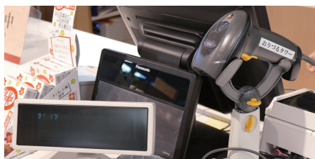
1Fの物産館のカウンターに設置されたPOSシステム