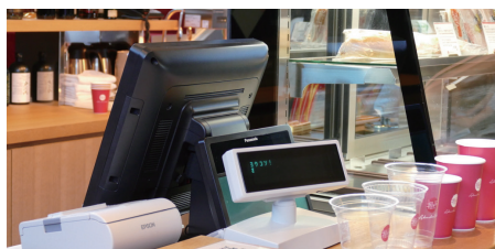
ひろしまの丘の横にあるテイクアウト専用のカフェのPOSシステム

券種は大人 / 子供料金や団体料金の他、旅行代理店で購入するクーポンなどを含めると 30~40 種類となりますが、券種毎に分類できるので、来場人数の推移や、併設のカフェ・物産館の売り上げの相関分析も可能となりました。これらの分析データを元に、新たなイベントやキャンペーンなどを考える上での有用な指標に活用されています。