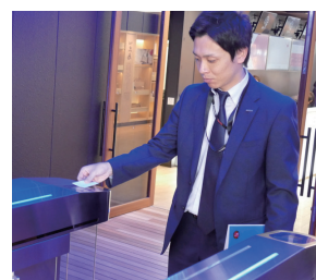
チケットのQRコードをかざして入場、スムーズな入場を実現する