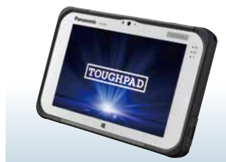
採用機種: TOUGH PAD 7型 FZ-M1 用途: 地理情報システム(GIS)情報ビューワー