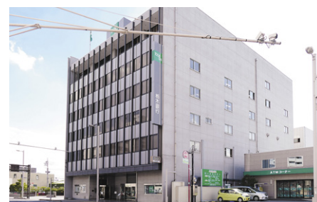
株式会社 栃木銀行 本店

栃木県ならびに埼玉県を中心に 92 店舗を展開する株式会社 栃木銀行様は、栃木県宇都宮市に本店を構え、地域金融機関として地域の方々とともに歩み、ともに発展を目指している銀行です。また環境保護への意識が高く、10年ほど前からすでに会議資料をプロジェクターで投写する方法でペーパーレス会議を行っていました。しかし、プロジェクターを使った会議はスクリーンから離れた席では見づらく、また小さな文字が読めないため、資料に記載できる文字数が制限されてしまうなどの課題がありました。そこで、新たな設備の導入を検討し、4Kの大型タブレットを使ったパナソニックのペーパーレス会議システムを採用しました。