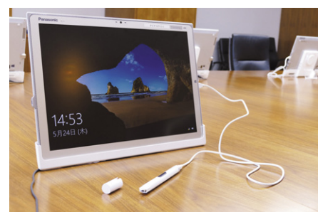
高画質な20型4Kタブレット「タフパッド FZ-Y1」

端末には、3840×2560 ドットの高画質な 4K タブレット「タフパッド」を 18 台採用。20 型の大画面モニターは、A3 サイズの資料も縮小することなくそのまま表示させることができ、銀行ならではの数字や文字の多い資料でも、まるで紙の印刷物を見ているかのようにストレスなく確認することが可能です。また、タブレットの標準機能から不要なものを削除することで、誰でも直観的に操作できるシンプルな GUI を実現しています。