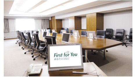
室内を見渡せるようなレイアウト