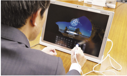
電子タッチペンを使ってスムーズな操作を実現