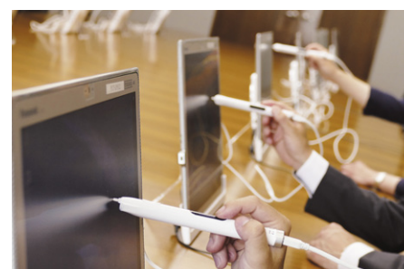
モニターに映る資料に直接メモを取ることが可能

4K タブレットに付属の電子タッチペンを使って、画面上でメモを書き込むことが可能です。会議参加者が別途メモ帳を持参する必要がなく、資料自体に直接書き込めるため、どのページの何の話に対するメモか、後から確認してもすぐに判別できます。また、メモが書き込まれた資料はセキュリティロックの掛かったファイルサーバーに保管され、会議参加者が自席から自分の資料だけを閲覧できるようになっています。