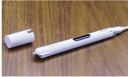
ペン先が沈むため、書いている感覚が伝わる電子タッチペン