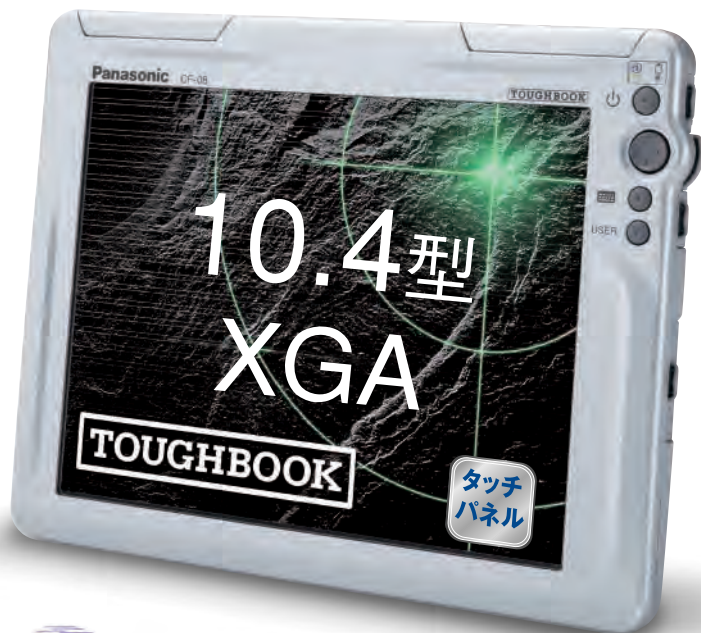
卓上での使用に、専用クレードルをご用意(オプション)