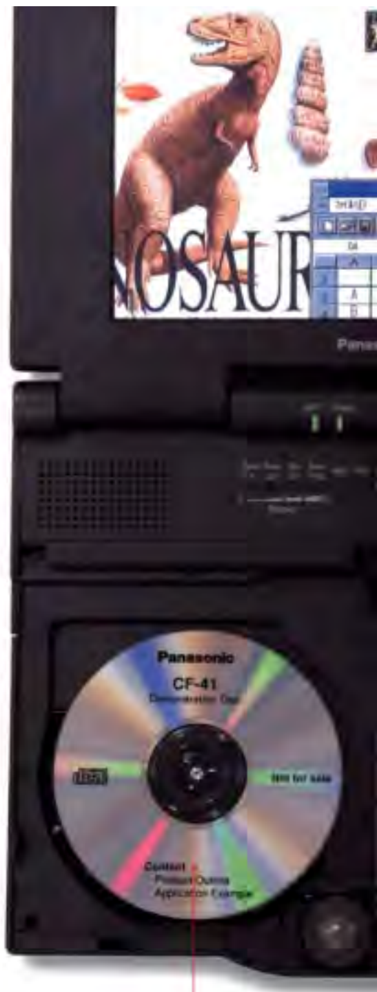
①12cmCD-ROMドライブ、もちろん、8cmCD-ROMも利用可能です。

ソフトのインストール作業は、フロッピーを入れ替えるのが大変。膨大なデータを扱うWindows対応ソフトでは、フロッピー数十枚にもなるソフトも登場…。そんな時でも、CD-ROMなら1枚でOK。インストールがグンとラクになります。また、今後増加する電子出版物やCD-ROM付きの雑誌も、すぐに楽しめます。