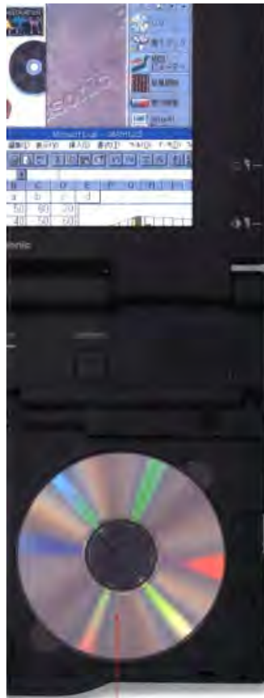
CD-ROMドライブの内蔵には CD-ROM用のメニューを収録 済みで使いに便利です。

内蔵のCD-ROMドライブはハイブリッドタイプの「Dashboardライト」(登録商標)です。