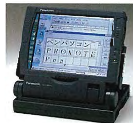
拡張スタンド (別売) CF-VEB011J オープン価格* [97年7月発売予定]