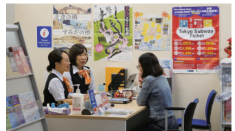
対面ホンヤクを利用して、お客様に情報をご案内