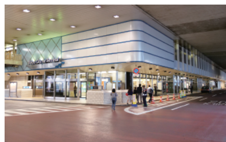
東京シティ・エアターミナル様(T-CAT様)の外観

T-CAT様の外国人観光案内所には、スタッフが常時2名体制で運営しています。しかし、外国語、特に中国語・韓国語ができるスタッフがいないときに、その言語で案内ができないことが課題となっていました。現在はスタッフがいつでも簡単に使うことができるように「対面ホンヤク」がカウンターに設置され、その課題は解決されました。導入のポイントとして、指向性マイクにより周辺の音に影響されにくいことや、音声認識の内容と翻訳後の内容が合っているか、事前に確認できることが挙げられました。さらに、2018年11月に追加された「音声による地図検索機能」と「地図/画像印刷機能」が業務の効率化が図られると評価をいただいています。