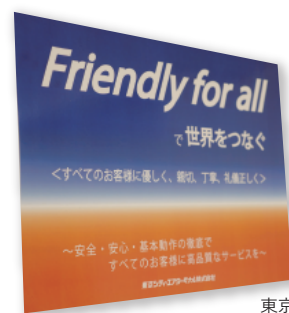
東京シティ・エアターミナル株式会社様の社訓

お問い合わせは 〒104-0061 東京都中央区銀座6丁目21番1号 汐留浜離宮ビル