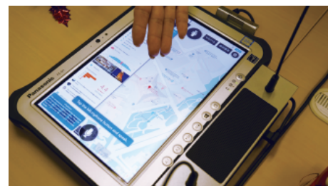
音声による検索機能を活用して、スムーズにご案内