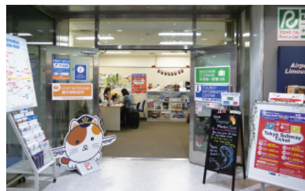
T-CAT様の1階にある外国人観光案内所