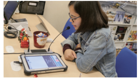
画面にタッチして話すだけの簡単操作

(※) 例えば、よく使うフレーズ登録、翻訳機能と同時に音声による情報検索、画像/地図などの印刷機能、定型文検索機能など