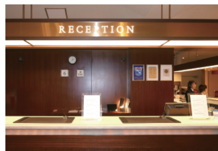
西鉄グランドホテル様のフロント

近年、宿泊客の3~4割が外国人観光客、そのうち7~8割がアジア圏からのお客様で、簡単な英語だけでは対応できなくなっています。従来は英語を話せるスタッフを配備してきましたが、特に中国や韓国からのお客様には、それぞれの母国語で接客する必要が生じていました。多様化する言語に、スタッフの教育・対応は限界。そんな折、パナソニックの展示会で「対面ホンヤク」をご覧になり、導入を検討されました。