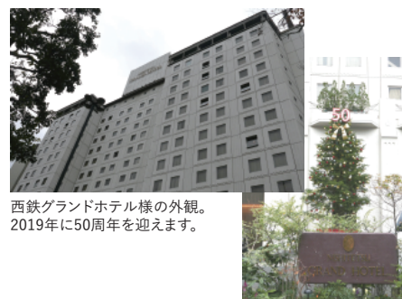
西鉄グランドホテル様の外観。 2019年に50周年を迎えます。

2019年に西鉄グランドホテルは50周年を迎えますが、これまでの歴史がお客様の信頼や伝統につながり、強みになっています。2019年のラグビーワールドカップや2020年の東京オリンピック・パラリンピック開催など、国際イベントが目白押しです。外国人旅行者からの人気が高まっている福岡の地で、お客様の期待に応えられるようにしていきたいと思っています。そのために、お客様とのコミュニケーションをしっかりと取ることが最も重要です。そのコミュニケーションで今まで伝えられていなかったことは、この「対面ホンヤク」で少しでも伝えられたらと思います。