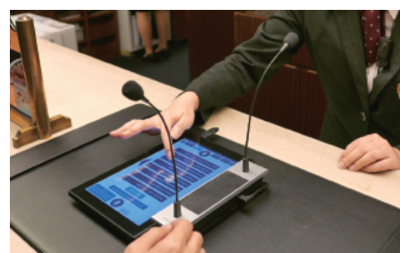
定型文も必要なものを簡単に呼び出せます。