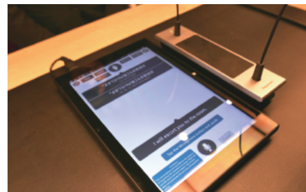
話した内容を翻訳した画面