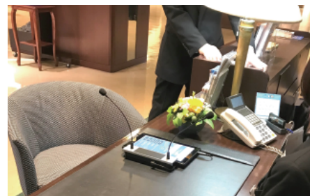
ゲストリレーションカウンターに置かれた「対面ホンヤク」

また、便利な機能も追加され、地図や画像を簡単に音声で呼び出せる、表示した地図を簡単に印刷できるなど、より丁寧なおもてなしができるようになりました。