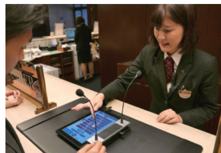
お客様と向かい合って翻訳内容を確認しながら会話できます。