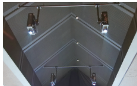
5台のマッピング用プロジェクターが、プレイヤーが集う床面に大海原を投影します。

大型の魚を釣ると正面のプロジェクターに魚の大きさなどが表示されます。「釣りスピリッツ」は、子供から大人まで人気のゲームで、通常6~8人が一度に遊べる遊具ですが、今回ナガシマスパーランドに納入されたアトラクションは24人が一度に遊べる超大型の設備になっています。パナソニックのマッピング用プロジェクターを5台使って大海原をプレイヤーの目の前に展開し、迫力のある画面を実現しています。