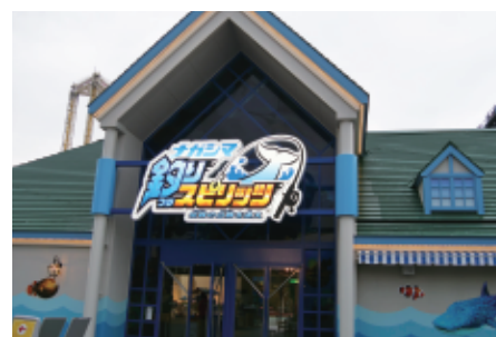
アトラクション入口に掲げられた、釣りスピリッツファンにはおなじみのロゴ

最終的にナガシマスパーランドへのプレゼンテーションで提案したアトラクションは、バンダイナムコが開発し、全国のゲームセンターなどで大人気の魚釣り体験メダルゲーム「釣りスピリッツ」をベースとしたアトラクションです。プレゼンテーションの後にも、さまざまな提案を重ねました。その結果、パナソニック製プロジェクターを使用したプロジェクションマッピングで実現する「釣りスピリッツ」を受注することができました。