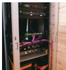
照明や音響などの操作は1か所で簡単です。