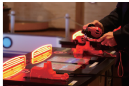
釣竿を模したサオコンを手に、リールを巻くのも力が入ります。