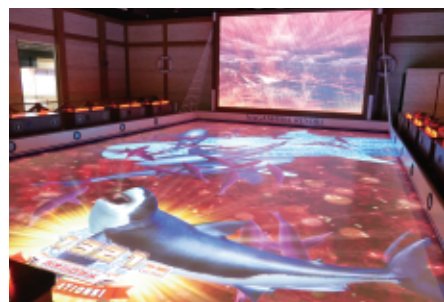
納入された「ナガシマ釣りスピリッツ」は、3方向から同時に最大24人がアトラクションを楽しめます。