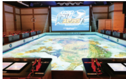
ナガシマ釣りスピリッツの全景