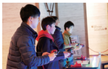
オープン以来、リピーターも増えているとのこと。

クリスマスの3連休には多くのお客様が来られ、ナガシマリゾートに宿泊のお客様には朝一番から並んでいただき大変好評を得ています。今後も屋内型の新アトラクションを計画しています。来場者数の増加につながるアトラクションを、パナソニックと運用を含めたソリューション提案により、お客様に喜ばれる企画を立てて行きたいと思えます。