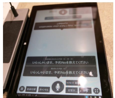
相手に伝える前に、翻訳結果を日本語で確認できる

また、レンタカー貸出の契約や保険などの説明時に専門的な用語も使用するため、正確に翻訳して伝えることが重要です。「対面ホンヤク」では、翻訳結果を日本語で確認することができるため、安心して利用することが出来ます。さらに、「定型文機能」や「マイフレーズ機能」を使い、業務でよく使うフレーズを事前に登録しておくことで、お客様と安心してスムーズな会話ができることも評価されました。