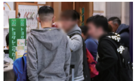
トヨタレンタカーのカウンターに並ぶアジア圏からのお客様