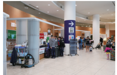
レンタカー各社のカウンターが並ぶ関西国際空港1階のエアロプラザ