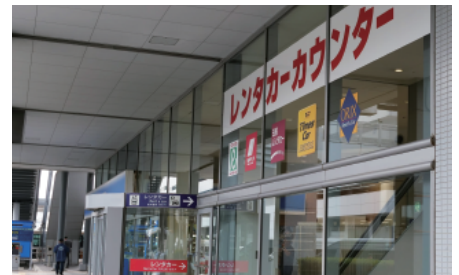
関西国際空港側にあるレンタカーカウンター入口

国際空港という場所柄、スタッフの語学能力は高く、現在は英語2名、中国語1名、韓国語1名、タイ語1名で外国人のお客様の対応を行っています。しかし外国語に堪能なスタッフが常時カウンターにいるわけではありません。これらのスタッフが不在の時や、別のお客様を対応している時などには、外国のお客様の対応に課題がありました。そのような時にでも外国のお客様に対応できるようにタブレット型多言語音声翻訳サービス「対面ホンヤク」が導入されることになりました。