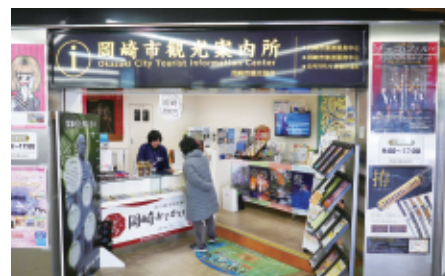
名古屋鉄道 東岡崎駅にある観光案内所

豊富な知識を持ったスタッフと充実した案内コンテンツを兼ね備えた岡崎市観光案内所様ですが、年々増えていく外国人観光客とのコミュニケーションが大きな課題となっていました。今回、その課題解決策として、「対面ホンヤク」をご導入いただくこととなりました。