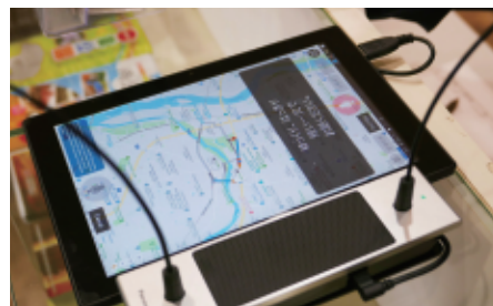
地図を表示させながらの会話も可能