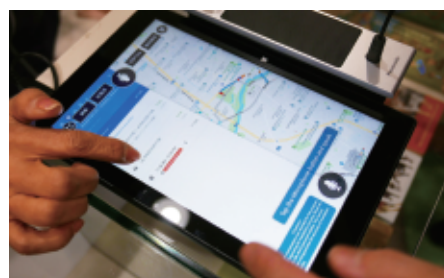
観光案内には不可欠な経路案内