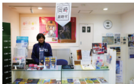
岡崎市の観光情報を豊富に提供する場として機能

このように、岡崎市観光案内所様でよく使う固有名詞などの単語を「対面ホンヤク」に登録することで、より精度の高い翻訳コミュニケーションを実現し、訪日外国客の方々への充実した観光案内にご活用いただいています。