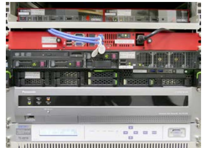
ネットワークカメラ収録サーバー