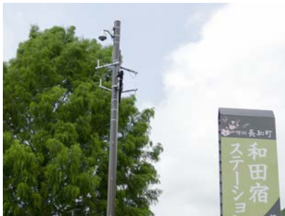
観光・防災Wi-Fiステーション（和田宿ステーション）