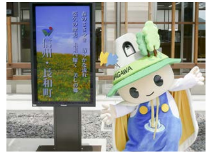
デジタルサイネージ

また、太陽光パネルと非常用バッテリー（蓄電池）を装備することで、停電などの緊急時にも電源を確保することができ、緊急時の機動性を高めます。蓄電池は約 10 年の長寿命タイプで、3 日間不日照でも継続した情報発信が可能です。