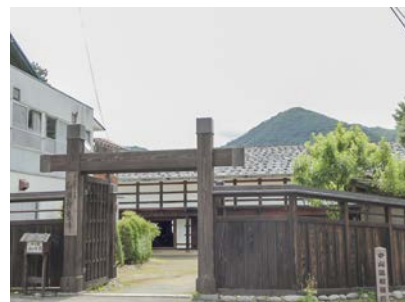
国史跡 和田宿本陣

ウェブサイトで公開されている情報には、インターネット接続サービスを介してアクセスします。非常時には、災害用統一 SSID「00000Japan（ファイブゼロジャパン）」を利用可能とすることで、外国人旅行者を含むより多くの利用者に接続を開放。ウェブのリダイレクト機能で町の災害情報ウェブページへ誘導し、町の提供する最新情報の取得を促します。