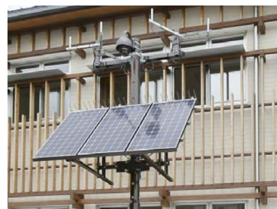
ネットワークカメラ・マルチアクセスコンセントレータ・太陽光パネル・蓄電池・サイネージ