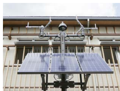
観光・防災Wi-Fiステーション （長和町役場本庁舎）