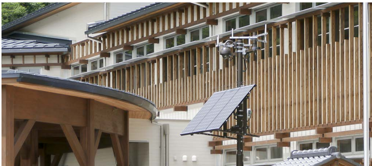
観光・防災Wi-Fiステーション（長和町役場本庁舎）