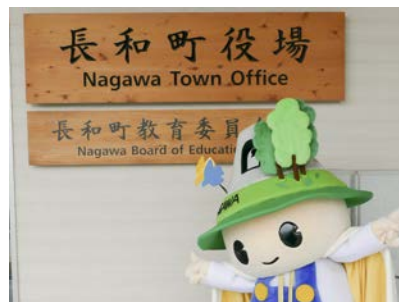
長和町マスコットキャラクター「なっちゃん」