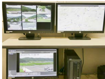
ネットワークカメラのモニタリング室