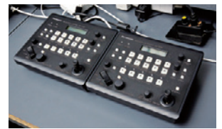
▲プリセットボタンで簡単カメラ制御が可能 なりリモートカメラコントローラー AW-RP50