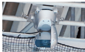
▲天井に設置されたAW-HR140は会場の端から端まで撮影可能