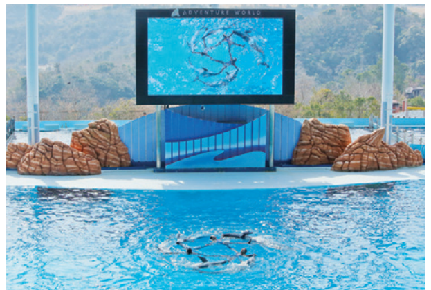
▲天井カメラで真上から撮影したパフォーマンスに、会場からは拍手喝采