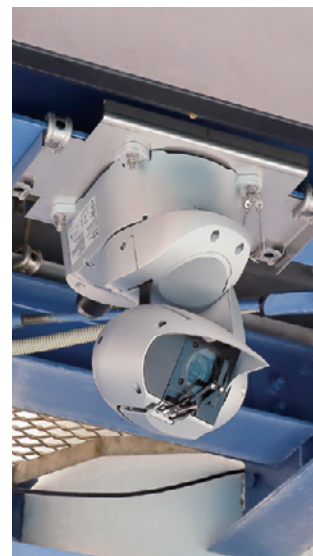
▲ハウジング不要で設置可能なAW-HR140を大型映像表示装置の下に取り付け