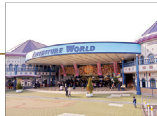
▲株式会社アワーズ様が運営する「アドベンチャーワールド」

2018年に開園40周年を迎えたアドベンチャーワールドは、「ここにスマイル 未来創造パーク」をテーマに、人間(ひと)、動物、自然を通してパークを訪れる一人ひとりが前向きになるきっかけを創り、人生の未来へプラスの影響をもたらす存在であり、いつまでも必要とされるテーマパークを目指しています。約80万平方メートルの広大な敷地には、動物園、水族館、遊園地など様々な施設が並び、大人気のマリンライブ「Smiles」では、会場全体が一体となって楽しめる、笑顔と感動に包まれた圧巻のステージが繰り広げられています。