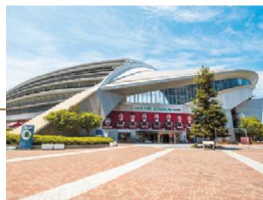
▲ノエビアスタジアム神戸のエンタランス

神戸市様が所有し、楽天ヴィッセル神戸株式会社様が運営管理を行うノエビアスタジアム神戸は、スタンドからピッチまでの距離が近く、大迫力のスポーツを間近で観戦できる体感型スタジアムです。日本プロサッカーリーグ「ヴィッセル神戸」のホームゲームのほか、2019年秋にはラグビーの国際的な大会を控えるなど、数々のスポーツイベントが行われています。