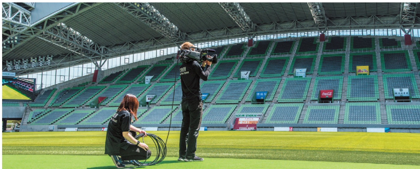
▲スタジアムではスタジオカメラAK-UC4000を2台使用して撮影

それらの映像を制御するスイッチャーには、2ME ライブスイッチャー AV-HS6000 を導入。ルーティングスイッチャーは AV-WM7400 シリーズを 72 入力 ×72 出力で採用されました。ライブに適した素早い操作が可能なコントロールパネルや、慌ただしいスポーツの現場でも瞬時に必要な機能が呼び出せるタッチパネル式のメニューパネルが、実際に作業するオペレーターの方々から高い評価をいただいています。ノエビアスタジアム神戸様では、基本的にプロのオペレーターが映像演出を行います。イベントによっては専門職でない方もスイッチャーを操作することがあるため、誰にでも分かりやすい操作性は非常に重要な採用のポイントでした。