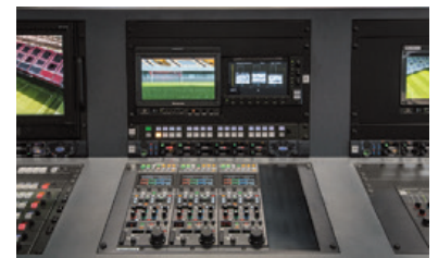
▲スタジオカメラを制御する、3台のリモートオペレーションパネル (ROP) AK-HRP1000