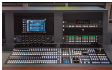
▲2MEライブスイッチャー AV-HS6000コントロールパネルと、埋め込み設置したメニューパネル

AV-HS6000 は、4 系統のマルチビューアー出力に対応し、画面レイアウトは 9 パターンから選択することが可能です。「以前は 9 インチのモニターを壁面にバラバラと設置しており見づらかったのですが、今回導入した 50 インチのモニターで AV-HS6000 のマルチビューアー機能を使ってみると、自分の見やすい位置に好きなように画面配置ができ、オペレーションがとても楽になりました」と前地様は話します。