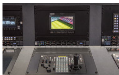
▲細かなオペレーションが可能なHDインテグレートドカメラ用リモートカメラコントローラー AW-RP120G