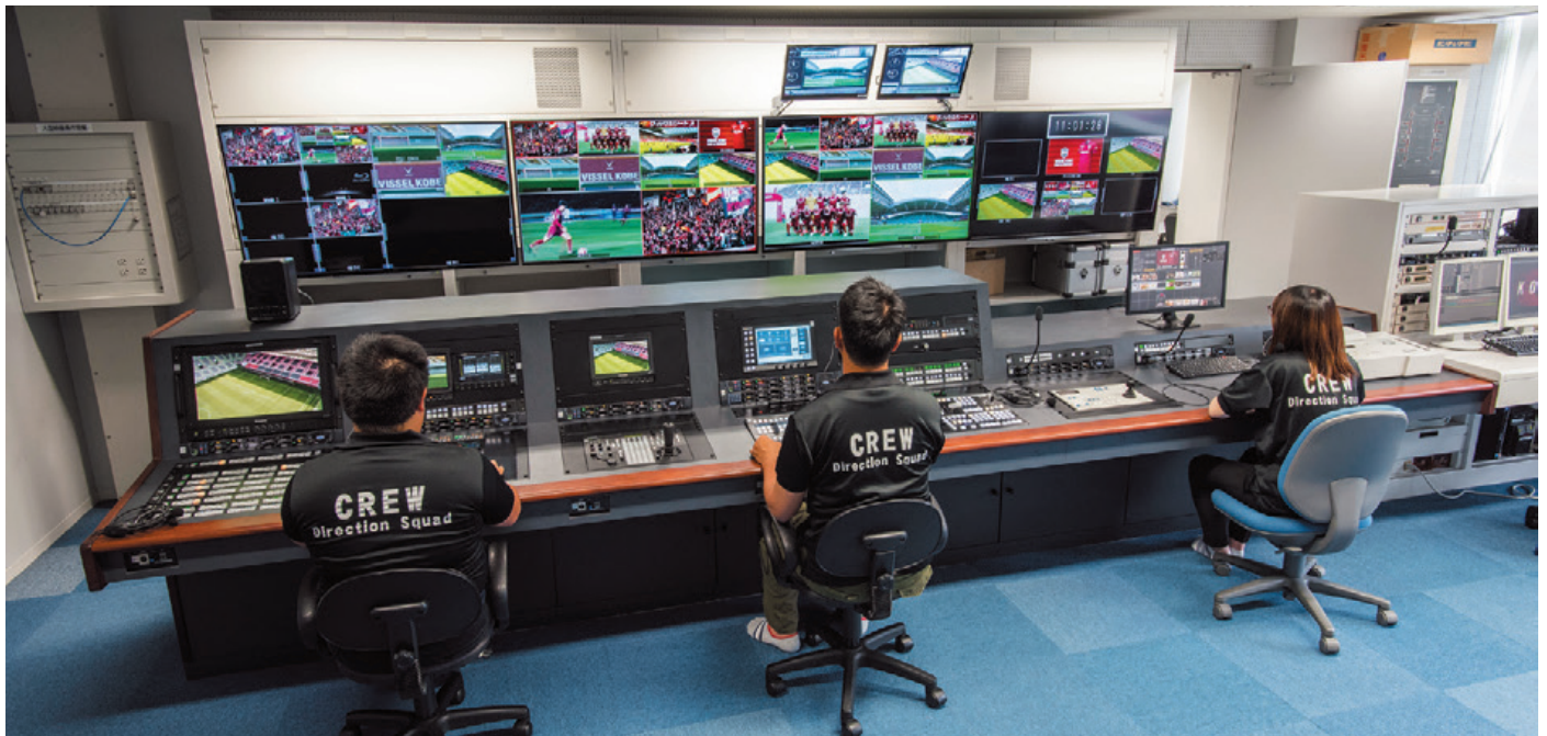
▲映像操作室に2MEライブスイッチャーAV-HS6000一式を納入