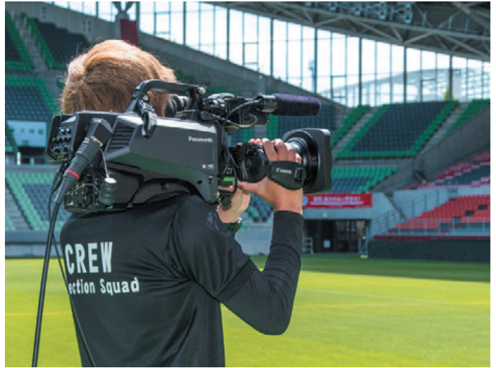
▲日向と日陰が混在する厳しい撮影環境で、AK-UC4000のHDR機能が活躍

可動式の屋根を採用しているノエピアスタジアム神戸様では、屋根を開けると時間帯によって半分日向/半分日陰という厳しい撮影環境になります。スタジオカメラ AK-UC4000/UC3000 はHDR撮影に対応しているため、明暗差の激しいシーンでも白飛びや黒つぶれを防ぎ、リアリティのある映像を撮影することが可能です。以前は、プレー中の選手を撮影していると、日の当たるスタンド席は白飛びして何も撮影できていないというお困りごとがありました。HDR機能の導入により、プレーを撮影していても観客席のお客様の表情まではっきりと撮影でき、会場との一体感を出せるようになりました。ノエピアスタジアム神戸様が掲げる『ピッチとスタンドの一体感』というテーマが表現できるようになったと、喜びの声をいただいています。