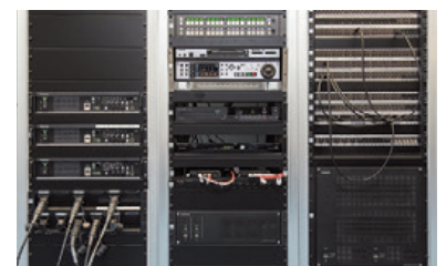
▲ラックに格納されたAV-HS6000のメインフレームやルーティングスイッチャー AV-WM7400シリーズ。スタジオカメラのCCUも3台格納