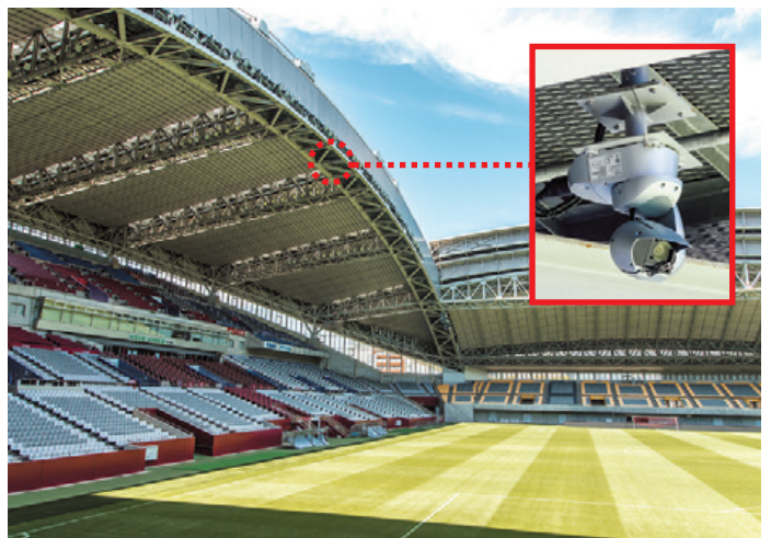
▲スタンド席の天井に設置されたAW-HR140でスタジアム全体を撮影

スタンド席の天井に取り付けられた屋外対応HDインテグレートドカメラAW-HR140は、パン±175°、チルト-30°~210°の回転台性能により、1台でスタジアムの端から端まで網羅し、主に会場全体の俯瞰映像や選手を上からズームで撮影することに活用されています。以前の天井カメラでは、コントローラーに軽く触れただけで激しく動いてしまう課題がありましたが、AW-HR140は細かなカメラワークが可能のため、ストレスなく撮影することが可能になりました。最も大きなポイントとなったのは、選手のリアクションを撮影する際、高倍率ズーム時でもブレが少なく、操作する手の感覚に合わせて思い通りに動作したことでした。選手の良い表情が出た時などリアルな映像演出が可能になったと高評を得ています。