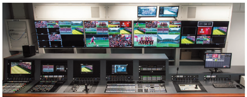
▲4つのモニターにマルチビューアー機能で分割画面出力