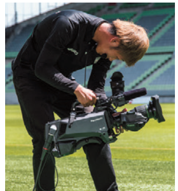
▲ビューファインダー AJ-CVF50Gで選手の位置を瞬時に確認