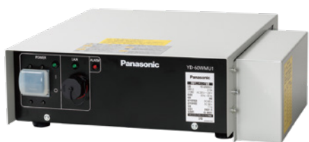
溶接モニタリング装置 (YD-60WMU1)