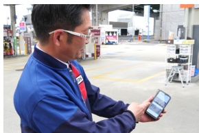
▲ スマートフォンから給油レーンをモニタリング