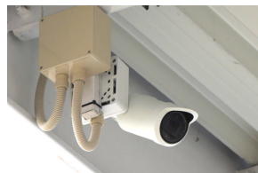
▲ 大型車専用レーンに設置された屋外ハウジング一体型カメラ