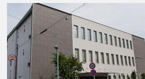
▲ ユアサ燃料株式会社様 本社