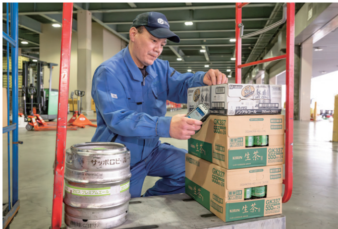
▲ 商品に付けられているバーコードをハンドヘルド端末で瞬時にスキャン。商品の検品作業は格段に早まった