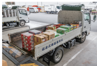
▲ 積み込みが完了。検品作業が迅速化されたことで、配送出発時間も前倒しが可能に