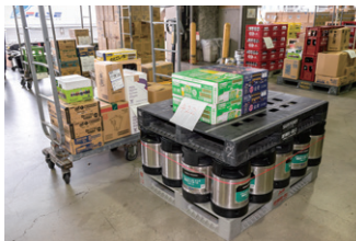
▲ トラックバースに、ルートごとにピックアップされたさまざまな形状・量の酒類商品が並ぶ