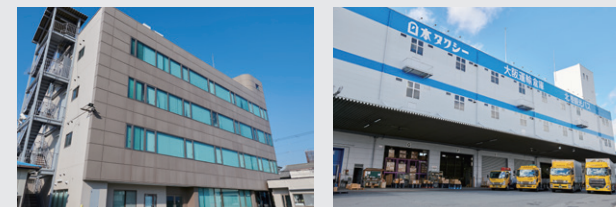
▲ 大阪運輸倉庫株式会社様 (本社)