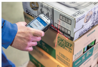
▲ 商品ごとに異なるバーコード位置も斜め角度のバーコードリーダーで、テンがよく連続して読み取れる