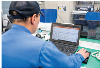
▲ 事務所内のシステム管理端末。配送状況をリアルタイムで確認することができる