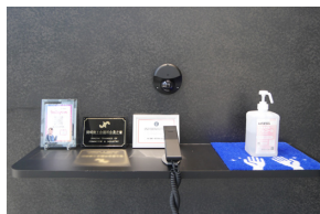
▲ 本社受付にもカメラを設置