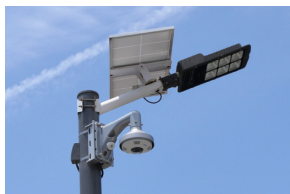
▲ 本社駐車場にも全方位カメラを設置