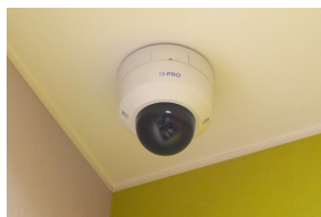
▲ バックヤードに設置されたドーム型カメラ