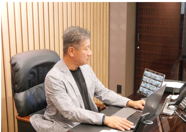
▲ タブレットで95か所のカメラを一括管理される村松社長