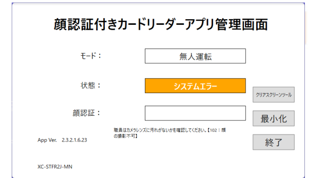
資格確認端末側(管理画面)